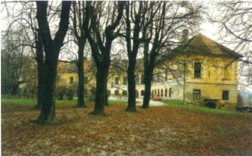
Pogled na dio perivoja i sjeverozapadno pročelje dvorca

je jednostavna: uzduž začelnog (zapadnog) pročelja proteže se hodnik iz kojeg se ulazi u prostorije koje se nižu uzduž glavnog pročelja. Dvanaesteroosno starije i osmeroosno