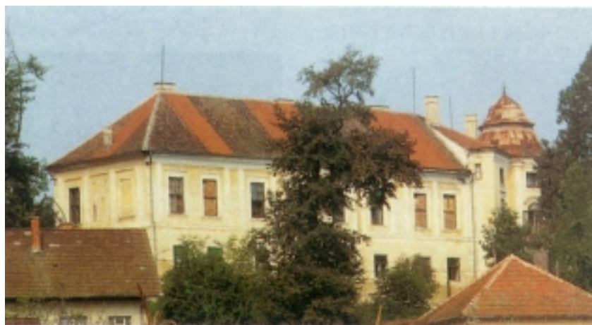
Južno pročelje dvorca