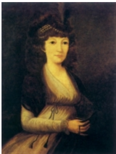
Grafica Eleonora Patačić

obavljao dužnost protonatora kraljevine Slavonije i namjesnika banske časti. Sa ženom Barbarom Beković izgradio je dvorac u Krkanu. Vjerojatno najpoznatiji Patačić bio je Baltazar II. (1663.-1719.), Stjepanov unuk, dugogodišnji kraljevski savjetnik u Dvorskoj kancelariji u Beču. Car Josip I. postavio ga je 1707. godine za velikog župana virovitičke županije i darovao mu je imanja Vrbovec i Rakovec, koja su nekad posjedovali Zrinski, a ostala su vlasništvo obitelji Patačić do smrti njezina posljednjeg člana. Baltazar je dobio i titulu baruna 1707. godine. Osnovao je društvo vinskih doktora Pinta , graditelj je obiteljske kapele u samostanskoj crkvi u Remetincu i pisac ljetopisa od 1687. do 1690. godine koji su kasnije izdali Kukuljević i Laszowski. Njegovim sinovima Aleksandru, Ludoviku i Gabrijelu podijeljeno je 1735. godine grofovstvo. Aleksandar (1697.-1747.) je bio pravnik i vrlo uvažena osoba na kraljevskom dvoru. Autor je poznatog djela Status familiae Patachich koje je 1740. godine izdao u Beču u povodu stjecanja grofovske titule. Gabrijel (1698.-1745.) je bio erdeljski biskup i kaločki nadbiskup. Pri diobi imanja nakon očeve smrti pripalo mu je imanje Vidovec i Krkanec. Ludovik (1699.-1766.) je bio veliki župan virovitički, a od 1760. godine i carski savjetnik. Dao