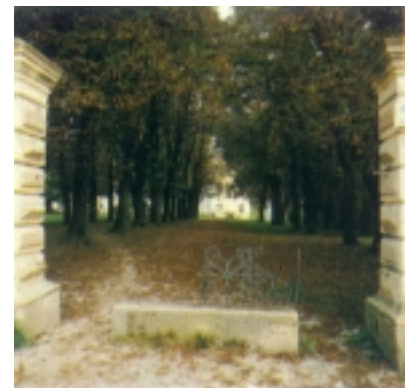
Ulaz u perivoj i prilazna aleja

oko dvorca sve ostane kao što je bilo. Jedan od glavnih razloga zapuštanja donjeg dijela perivoja bila je tada neasfaltirana glavna cesta Krapina - Zabok koja je, s danas nestalom dvostrukom alejom kestena,