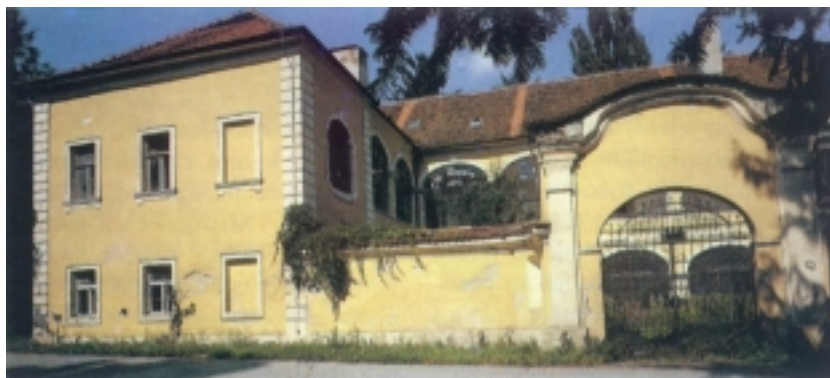
Ulaz u dvorac i jugozapadno pročelje dvorca

Zajezda je bio glavni dvorac obitelji Patačić, staroga hrvatskoga plemićkog roda koji se početkom 16. stoljeća doselio u Hrvatsko zagorje iz Bosne. Najstariji poznati Patačić je Nikola koji se 1536. godine oženio Katarinom Herkffy i po njenom posjedu Milen ili Zajezda uzeo predikat "de Zajezda" koji su Patačići zadržali do svog nestanka. Stvari vlasnici Zajezde postali su Patačići 1555. godine kraljevom darovnicom. Car Maksimilijan II. obnovio je darovnicu 1562. godine, a Rudolf II. potvrdio im je plemstvo 1608. godine. Nikola Patačić imao je dva sina, Petra i Ivana. Petrovo potomstvo izumrlo je u četvrtoj generaciji, a svi daljnji Patačići potječu od Ivana. Obitelj se počela bogatiti za vrijeme Ivanova unuka Stjepana (1576.-1636.) koji je