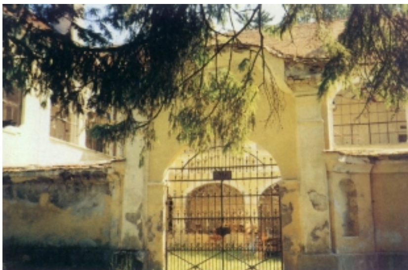
Ulaz u dvorac Zajezda, današnji izgled

taj. U njemu su smješteni i drugi brojni sadržaji sadašnjega općinskog središta s više od dvije i pol tisuće stanovnika, primjerice privatna liječ-