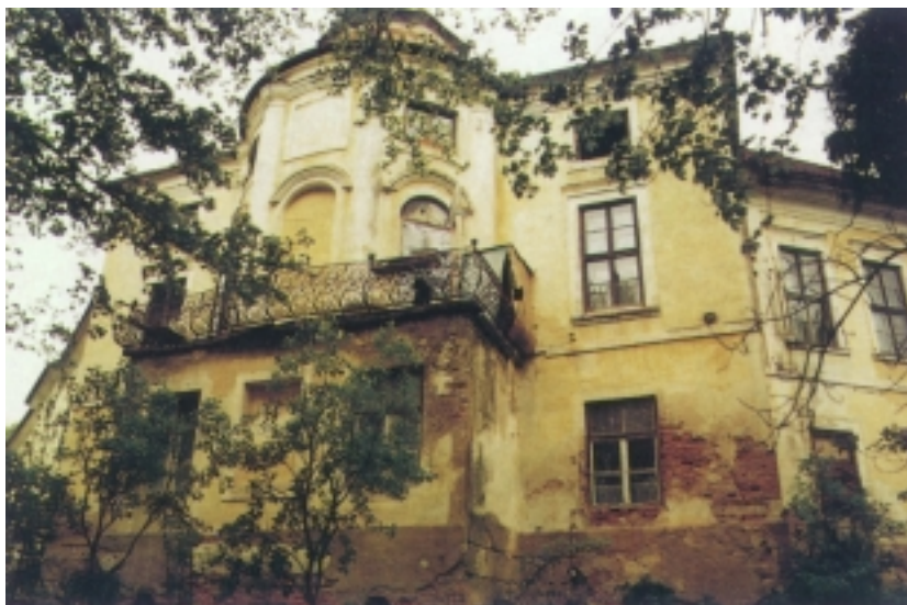
Sadašnji izgled dvorca u Svetom Križu Začretju

koji je potpuno zapušten i obrastao. Nešto je bolja situacija s parkom koji je dio prostranog trga što ga zatvaraju crkva i dvorac. Tu su staze djelomično uređene i trava podšišana, ali se visoko i lijepo drveće ipak slabo održava.