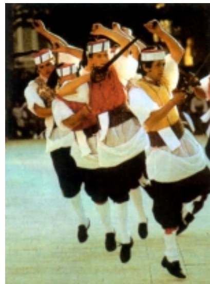
Nastup Kumpa nije iz Blata

Jednu od tih bitaka, onu iz 1298. godine, sada Korčulani svake godine ponavljaju kao kostimiranu simulaciju. Ne čine to samo zbog jedne od najvećih pomorskih bitaka toga doba, već zato što je u toj bitki kao kapetan mletačkog broda zarobljen Marco