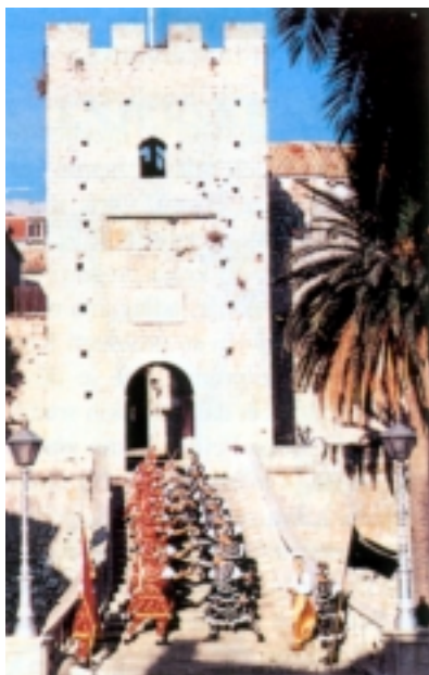
Moreška na gradskom ulazu Korčule

Dugotrajne su se vojne pripreme s vremenom pretvorile u živopisne folklorne igre, a vjerojatno su glazba i ples služili da privuku mladež. Sada se Kumpanija izvodi u svim korčulanskim mjestima kao živopisna plesna igra, stručnjacima neobično zanimljiva zbog mnogobrojnih zaboravljanih etnografskih značajki. Najčešće se izvodi u Blatu gdje je temeljito proučena i istražena, ali se s manjim razlikama prikazuje i u drugim mjestima.