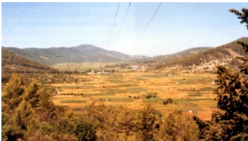
Polja u blizini Blata

jatno zato što je Dubrovnik po iskustvima iz Konavala bio najpogubniji za tadašnju široku autonomiju, isti je kralj 1417. oduzeo Dubrovniku sve srednjodalmatinske otoke. Korčula tada s cijelom hrvatskom obalom, (s izuzetkom Dubrovnika), dolazi 1420. pod mletačku upravu, pod kojom će ostati sve do 1797. godine. Mlečani su znatno ograničili korčulansku autonomiju, ali je nisu potpuno ukinuli. Otok je bio granično područje i stoga su dozvoljavali određen gospodarski razvitak. Zbog velike strateške važnosti, te stalnih opasnosti s mora i s kopna, otok je, a posebno grad Korčula, bio dobro utvrđen. Dugotrajni mletački utjecaj učinio je da današnje ime otoka ne potječe od starohrvatskog imena Krkar već od mletačkog Curzola , kako su Mlečani preveli stari grčki naziv Korkyra ,