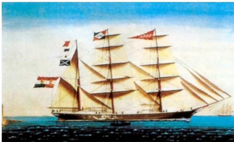
Akvarel jedrenjaka Sabioncello iz 19. stoljeća

Da su Korčulani nadareni za plesne igre s mačevima dokazuje još jedna plesna igra - Moreška . To je mačevalački ples koji se izvodi isključivo u gradu Korčuli. Nekada se ozvodio po cijelom Sredozemlju, a prikazuje sukob dobra i zla, pretvoren u simboličan sukob kršćana i muslimana. Ples izvode dvije skupine moreškara. Bijeli su obučeni u crvene, a crni u crne kostime. Predvode ih kraljevi koji se bore za djevojku Bulu, zaručnicu Bijelog kralja. Bijeli pobjeđuju i Bula se vraća svom zaručniku. Ples se izvodi u sedam različitih figura pri čemu se tempo ubrzava, a udarci mačeva postaju sve žešći. Nekada se kažu, ova igra izvodila u gotovo svakom sredozemnom gradu, a u Korčuli se izvodi od 17. ili 18. stoljeća. Po nekim izvorima nekada se zapravo izvodila uz pratnju tam-tam bubnja, ali je u Korčuli glazbena podloga prebačena na puhače, čime je autentičnost korčulanske Moreške definitivno zajamčena.