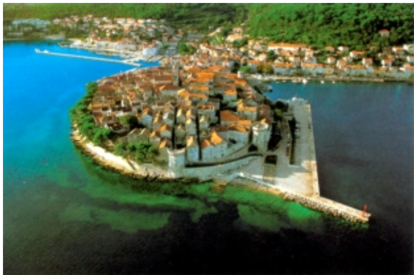
Pogled na grad Korčulu

retljana, dakle, teče na Korčuli proces slavizacije Romana i kristijanizacije Slavena. Slaveni su prihvatili kršćanstvo i postupno, kao brojniji, asimilirali preostalo romansko stanovništvo.