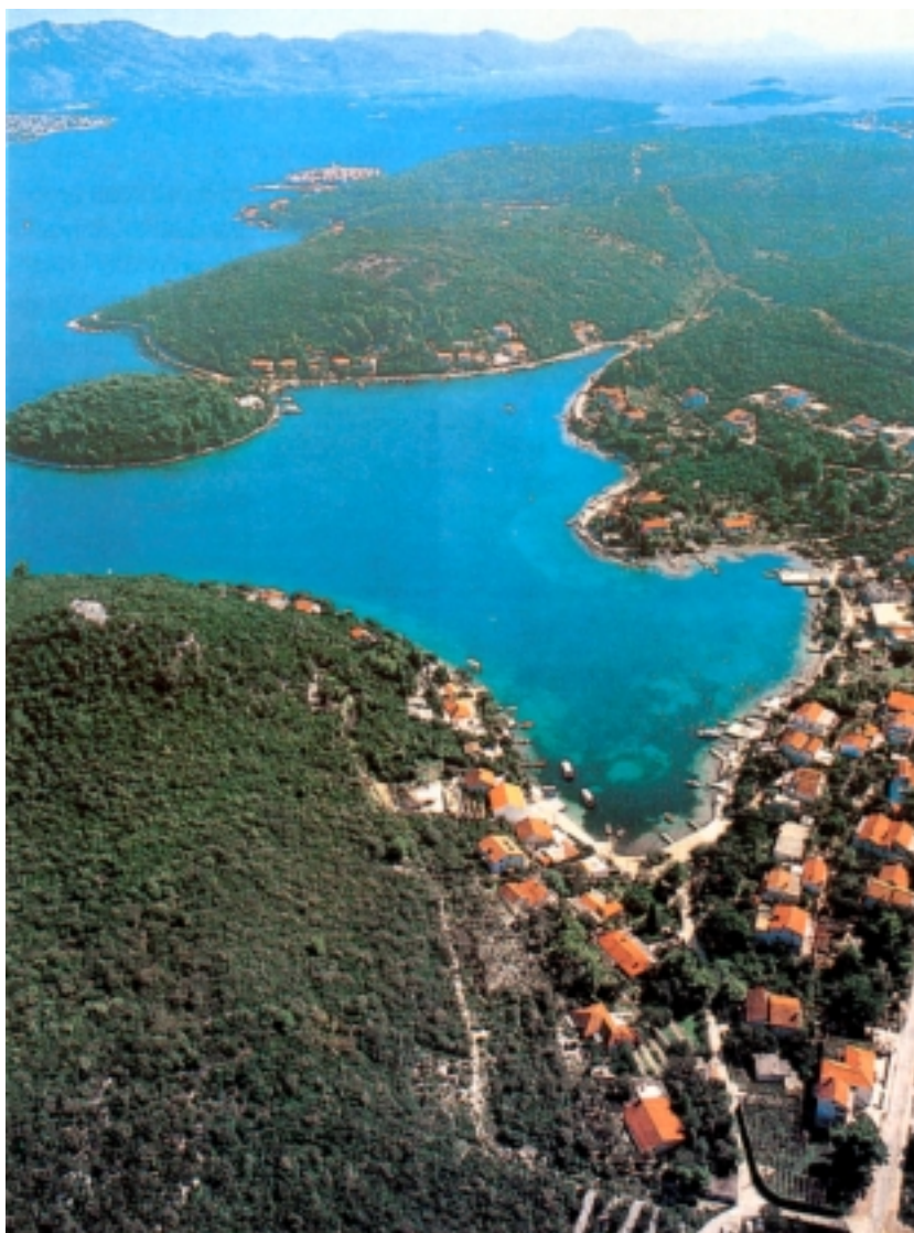
Sjeveroistočna obala otoka

lja, ali se pretpostavlja da je ono bilo na zapadnom dijelu otoka, između Vele Luke, Potime i Blata Knidijci (Knidani) su otoku dali i osnovu sadašnjeg imena jer su ga nazvali Korkyra, iako se ponekad govorilo da je ime otoka povezano s glagolom 'krčiti'. O kolonizaciji Knidijaca izričito govori putopisac Pseudo Skymnos u svom djelu Periegesis (Opis svijeta) u 2. stoljeću pr. Kr., a stoljeće kasnije kroničar Strabon, zbog obilja šuma, dodaje imenu otoka pridjev melaina (crna) kako bi se razlikovao od Krfa, izvorne Korkyre. Valja dodati kako i za Korčulu postoji