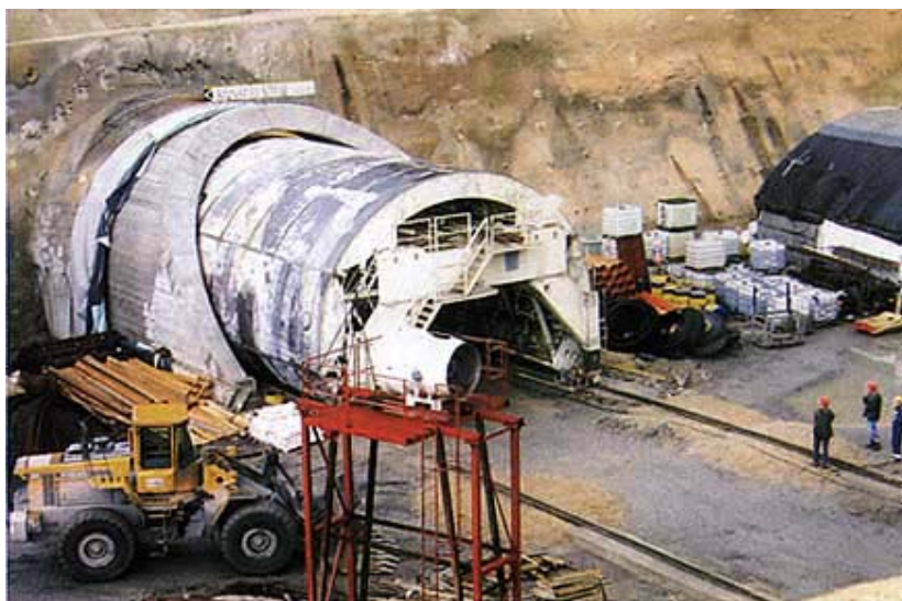
S izgradnje tunela Javorova kosa

zapravo iza tunela Rožman brdo (508 m i 528 m), ali će se uskoro u promet pustiti samo do čvorišta Vrbovsko od kojega se do ceste D3,