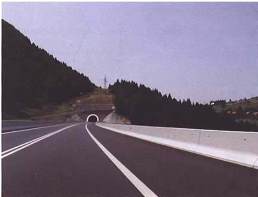
Detalj završnog dijela dionice Kupjak – Vrbovsko

interregionalni čvor Bosiljevo II gdje se spajaju autoceste za Rijeku i Split. Dionica je gotovo cijelom svojom duljinom poluautocesta, osim u početnim dijelovima gdje se nalaze tunel Rožmanovo brdo i vijadukt Hambarište.