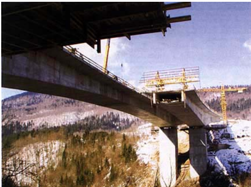
Radovi na mostu Kamačnik

bom riješen nastali spor. Na vijaduktu Stara Sušica zajednički su radili Industrogradnja d.d. Zagreb i Konstruktor-inženjering d.d. iz Splita, a Viadukt d.d. na proboju tunela Čardak iz Zagreba. Nakon raskida ugovora s izvoditeljima tunela radove je na cijeloj trasi preuzela posebna poslovna udruga koju su sačinjavali: Strabag AG iz Spitala u Austriji, Viadukt d.d. iz Zagreba i Konstruktor-inženjering d.d. iz Splita s podizvođačima Hidroelektra niskogradnja d.d. i Industrogradnja d.d. iz Zagreba. U izgradnji mosta preko Dobre sudjelovala je i tvrtka Primorje iz Ajdovščine. Vrijednost cijele investicije bila je 988 milijuna kuna.