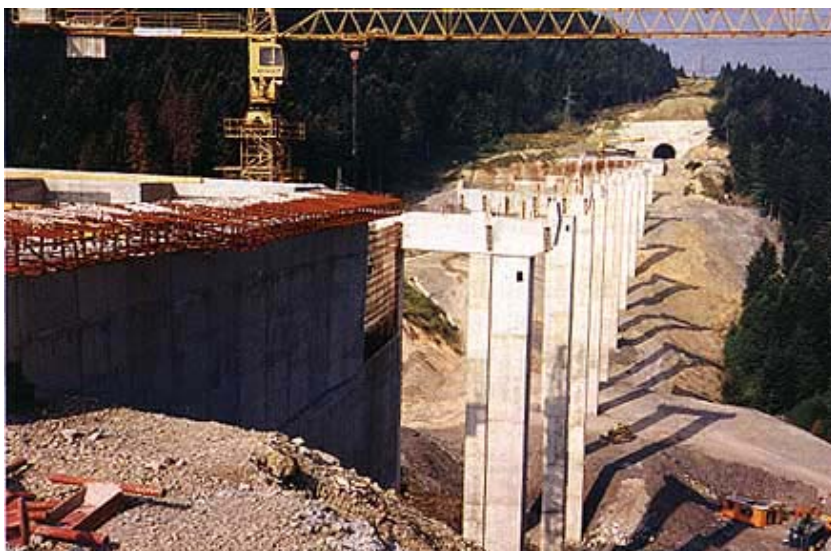
Gradnja vijadukta Stara Sušica

I čvorište Ravna Gora i čvorište Vrbovsko svrstavaju se u tip trube. Radovi na donjem ustroju trase poluautoceste započeli su u kolovozu 1998., a izgradnja većih objekata: tunela Javorova kosa (1460 m) i Pod Vugleš (620 m), vijadukta Stara Sušica (420 m) te tunela Čardak (601 m) u lipnju 1999. U 1998. i 1999. godini zemljane je radove na trasi izvodila 66. bojna Hrvatske vojske, a podizvođač je bila tvrtka Hidroelektra niskogradnja d.d. iz Zagreba. Nakon povlačenja 66. bojne (2000.), Hidroelektra je nastavila s radovima. Na probouju tunela Javorova kosa i Pod Vugleš radili su Spie Batignolles iz Francuske i Mediterranean Union Tuneli d.d. iz Zagreba. Oni su radili od 15. lipnja 1999., ugovor je raskinut 31. srpnja 2001., a nedavno je, kako saznajemo, nagod-