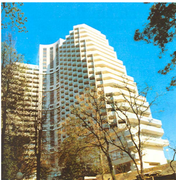
Slika 7. Detalj najvećeg hotela