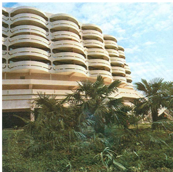
Slika 5. Jedan manji hotel u kompleksu

Osim smještajnih zgrada sa svim potrebnim sadržajima, izgrađen je i čitav niz samostalnih zgrada za zabavu i rekreaciju gostiju, nekoliko restorana s posebnim kulinarским specijalitetima, diskotek, kuglana, teniska igrališta i mini-golf. Na samoj morskoj obali izgrađena je 500 m duga pla-