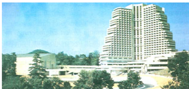
Slika 6. Pogled na najveći hotel kompleksa

Valja reći da je vrijednost isporučene opreme bila zaista impresivna. Za ilustraciju može se navesti da je Končar iz Zagreba samo za kuhinje s potrebnim hladnjačama isporučio opremu vrijednu više od 7 milijuna dolara. Exportdrvo iz Zagreba isporučilo je stolariju, namještaj za restorane i hotelske sobe te sav ostali nužan inventar za više od 20 milijuna dolara. Taj je iznos bio veći nego što je iznosila vrijednost robe koju je to poduzeće vlastitom vanjskotrgovinskom mrežom prodavalo u to vrijeme u Rusiji.