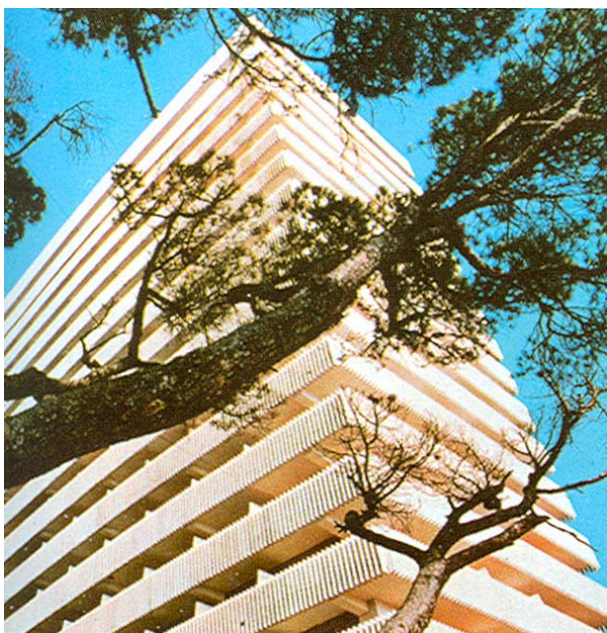
Slika 1. Hotel Jalta na Krimu

Nedostatak hotela uopće, a posebno u turističkim područjima, nagnao je ruskog investitora, Glavnu upravu za inozemni turizam, da otvori rusko tržište i za hrvatske graditelje. U to vrijeme (1973.) u Hrvatskoj su turizam i izgradnja turističkih objekata bili vrlo dinamični. Ruski turisti bili su sve češći gosti na Jadranskom moru. Kako je s Rusijom postojala znatna vanjskotrgovinska razmjena, logično je bilo da nam Rusi, s obzirom na naše iskustvo u projektiranju, izvedbi i opremanju hotelsko-turističkih objekata, ponude gradnju hotela, prije svega u turističkom području na Crnom moru. Kao prvi konkretan posao ponuđeno je Ingru da završi hotel u Jalti na Krimu, gradnju kojega je ruski izvođač godinama odugovlačio. Usput je bila nagoviještena i mogućnost gradnje novoga turističkog kompleksa u Dagomisu pokraj Sočija. Međutim, uslijedila je intervencija Savezne komore u Beogradu da se najavljeni poslovi i ulazak na rusko tržište moraju podijeliti s Union Engineeringom iz Beograda.