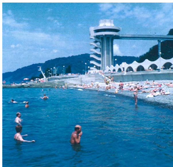
Slika 8. Pogled na plažu hotelskog kompleksa

včević iz Splita. Instalacije je izvelo ondašnje montažno poduzeće Monter iz Zagreba. Zbog nepovoljnih geoloških uvjeta građenja zgrada je temeljena na benoto pilotima, a radove je izvelo poduzeće Geotehnika iz Zagreba. Na ostalim su građevinama radili još građevinsko poduzeće Vranica iz Sarajeva i građevinsko poduzeće Mavrovo iz Skopja. Nije potrebno posebno isticati da je uz te glavne izvođače radio čitav niz kooperanata, a kamioni-šleperi praktički su svakodnevno pristizali na gradilište i dovozili razne materijale i opremu. To je stvaralo dodatne obveze nositelju posla, vezane za špediciju i carinu. Ingra je kao nositelj posla vrlo uspješno koordinirala i usklađivala aktivnosti svih sudionika u tom složenom poslu te pred investitorom dostojno zastupala potpisani ugovor. S tako mnogo sudionika u poslu, koordinacija i usklađivanje raznovrsnih interesa, i ukupnih i pojedinačnih, nije bila nimalo lak posao. Može se slobodno ustvrditi da tako složen graditeljski zahvat ni jedno poduzeće, koje je bilo uključeno u projekt, ne bi samostalno moglo ugovoriti i ostvariti. Treba stoga biti obje-