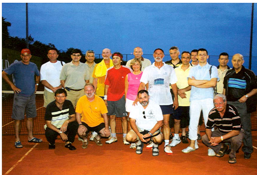
Sudionici teniskog natjecanja UGIS-a

njera morali osvježavati na česmi montiranoj pokraj terena. Pod budnim okom glavnog organi-