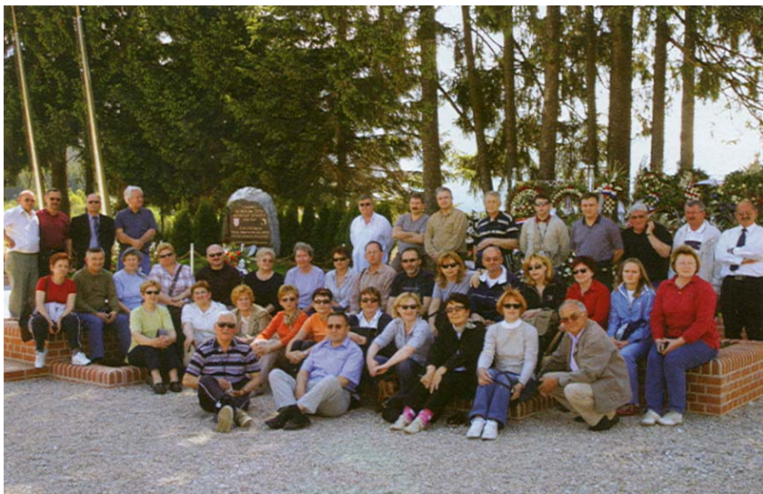
Sudionici stručnog putovanja ispred spomen obilježja u Bleiburgu

vili puna 4 dana. Program boravka bio je vrlo bogat. Tako su razgledali Trg Marije Terezije sa dva muzeja, dvorac Hofburg, augustinsku crkvu (sa spomen-pločama našim velikanima – J. J. Strossmayeru, J. Dobrili, A. Baueru i F. Račkom), muzej Albertina te katedralu Sv. Stjepana. Zatim su razgledali dvorac Schönbrunn, ljetnu rezidenciju obitelji Habsburg, i poznati dvorac Belvedere u kojem je potpisana predaja njemačkih trupa Crvenoj armiji.