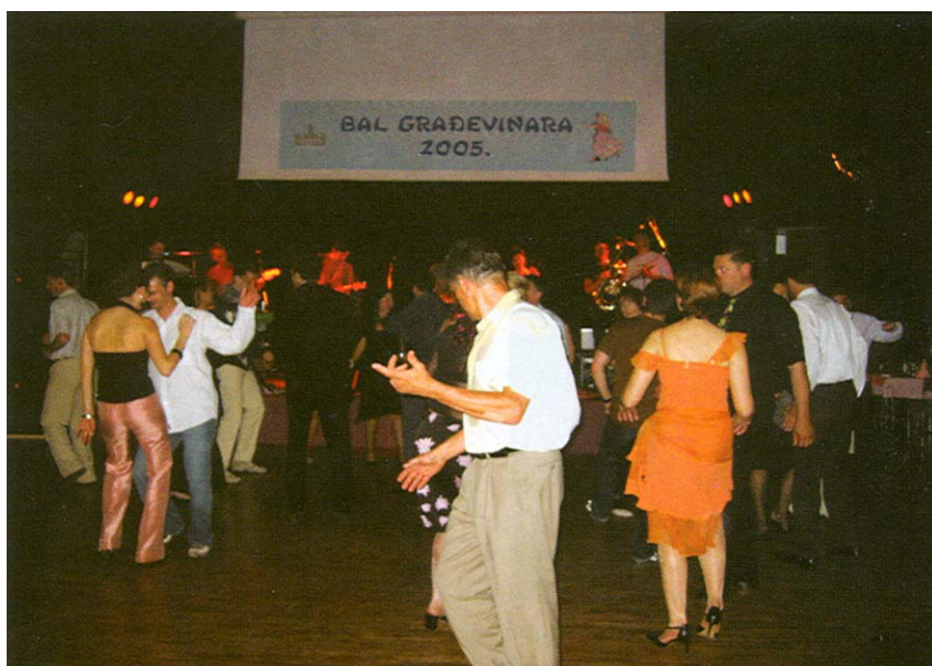
Detalj s bala građevinara u Splitu

bolična, a za poticanje budućih članova otvorena je i web stranica ( www.ugis.hr ) koja će bilježiti sve informacije o sadašnjim i budućim zbivanjima.