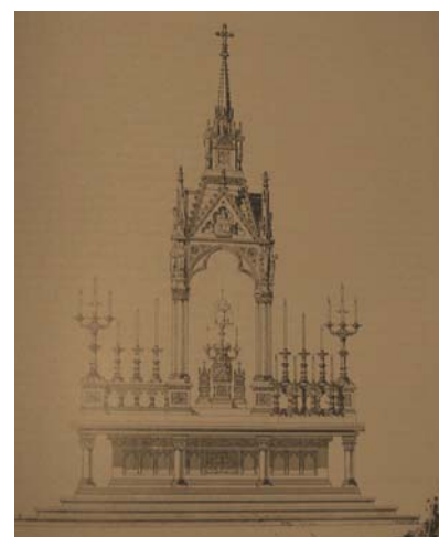
Bolléov crtež glavnog oltara

No to je najpoznatije Bolléovo djelo dodatno pokrenulo mnoge netrpeljivosti i nepravedne ocjene njegova rada, posebno što su mnoge izmjene često bile uzrokovane konstruktivnom nuždom. Najoštriji je njegov kritičar bio Gjuro Szabo koji je s konzervatorskih pozicija oštro zamjerio Bolléu što je u svojim idealiziranim restauracijama, u duhu teorije francuskog arhitekta Eugène Emmanuel Viollet-le-Duca, mnogim spomenicima izmijenio prvotni lik. U osporavanju toga i svih ostalih njegovih restauracija čak rekao da se "nje