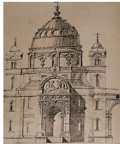
Jedan od crteža za kapelu na Mirogoju