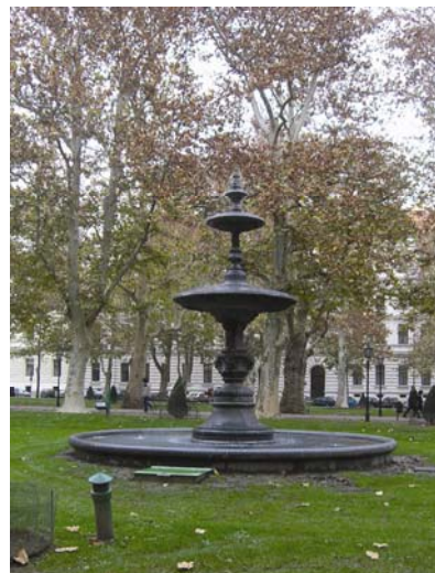
Fontana na Zrinjevcu u Zagrebu