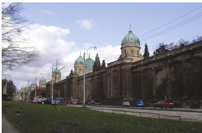
Pogled na mirogojske arkade izvana

ekonomskoga, kulturnog i političkog života svoje političke cjeline, u ovom slučaju Hrvatske. Iako je krajem 18. stoljeća bio značajno manji od primjerice Splita i Dubrovnika, do početka 20. stoljeća povećao se više od osam puta i s približno 80.000 stanovnika sabrao je trećinu cjelokupnog stanovništva sjeverne Hrvatske i polovicu ukupne industrijske proizvodnje. Zagrebu stoga pripada primat gotovo u svim područjima gospodarskoga, društvenoga i kulturnog razvitka, a posebno se to očituje u njegovim raskošnim i monumentalnim zgradama. Valja reći da je tome pridonijelo i administrativno ujedinjenje 1850. Kaptola, Gradeca i