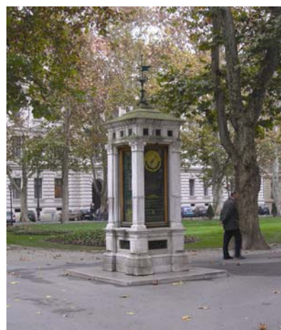
Meteorološki stup na Zrinjevcu