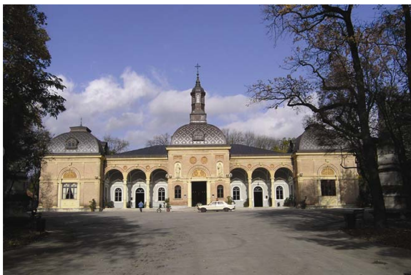
Mrtvačnica na Mirogoju

nadrastao vrijeme u kojem je djelovao i svojom građevinom najavio neka nova vremena u shvaćanjima i odnosima u prostoru. Mirogoj je stoga najuspjelije i najvrjednije djelo Hermana Bolléa s kojim je nadrastao svoje vrijeme bezvremenskom graditeljskom vrijednošću. Uostalom nekadašnja se Grobna cesta, koja je zapravo nastavak Bijeničke ceste, u čast graditelja Mirogoja danas naziva Alejom Hermana Bolléa.