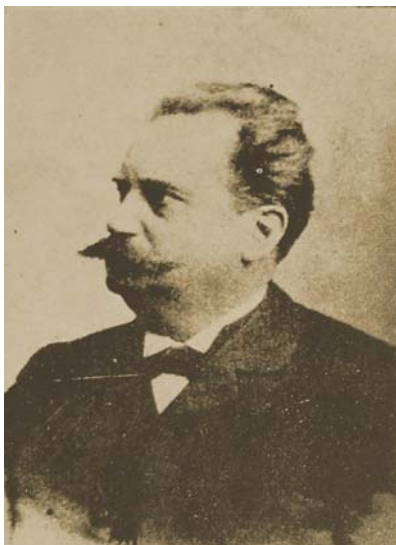
Herman Bollé (1845.-1926)

This year we mark the 160th anniversary of the birth of Herman Bollé, great Croatian builder and educator who, although born in Köln, worked during almost all of his active years in Croatia. He designed, built and renovated numerous buildings in Zagreb, but was also active in the entire territory of the former Banovina of Croatia. On the total, he worked on more than 70 various buildings, and his best known projects in Zagreb include renovation of the Zagreb cathedral after the 1880 earthquake, and construction of the Mirogoj cemetery. He built buildings in the historicist style which was then the most popular style in Europe. He designed in the style of German renaissance the Museum of Art building and the Vocational School, which was in fact founded and directed by him for many years. Later on, he also founded a separate School of Civil Engineering. With his exposition pavilion drawings and those made by his students, he also participated, and often received awards, on international expositions in Trieste, Paris and Budapest. He also took part in the preparation of the urban development plan for the city of Zagreb, and participated in the realization of fountains and fences around some big public buildings, but also found time to design theatre costumes, stained glass windows and various artisanal objects. The article is complemented with the list of all of his works.