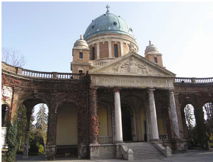
Kapela Krista Kralja na Mirogoju

Mirogoj je zapravo na neki način urbanistička "kruna grada", svojevrsna simbioza arhitekture, skulpture i hortikulture. Njegov je autor kao vrstan arhitekt europskog formata u tom djelu eklektik onoliko je i arhitektura toga doba eklektična (uostalom historicizam su kao stil dugo nazivali eklekticismom), ali slobodan u svom zadatku i u stvaralačkoj logici. Stoga je tim djelom, koji mnogi smatraju vrhuncem njegova stvaralaštva,