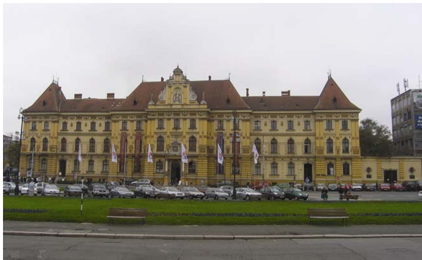
Zgrada Muzeja za umjetnost i obrt i Obrtne škole

Mirogoj je Bollé gradio u tišini na sjevernim obrežjima grada tijekom nekoliko desetljeća i to je jedan od najvećih projekata europskog historizma uopće. U sklopu projekta izgrađene su pola kilometra duge arkade sa 20 kupola te brojni drugi sadržaji među kojima je najdojmljivija kapela Krista Kralja. Valja ipak reći da je Bollé namjeravao cijelo groblje okružiti arkadama, a od toga je bio prisiljen odustati zbog nedostatka novca. Tako je zapravo Mirogoj kao jedno od najljepše uređenih groblja u ovom dijelu Europe ostao zapravo nedovršen.