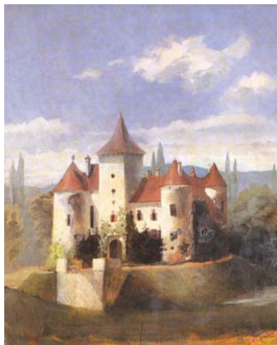
Utvrdra Bisag na jednoj slici iz 19. st.

ka mogućih mina, posebno u prvom slučaju. Ipak dvije smo utvrde u više navrata neuspješno pokušavali pronaći. Jedna je Cukovec (br. 4/2004.), utvrda na brdovitim obroncima iznad korita rijeke Bednje, sjeverno od Ivanšćice, koju inače Szabo uopće ne spominje, a do nje i nema nikakvih oznaka. Druga je tajanstveni Stari grad (br. 4/2005.) na sjevernim obroncima Krndije do kojega smo se pokušali probiti i sa sjevera i s juga. Čak smo dobavili i precizan planinarski priručnik s kartama. Postoje čak i oznake koje se iznenada prekidaju, a lutanje po okolnim strmim vrhovima nije dalo nikakve rezultate. U Planinarskom savezu Hrvatske ističu da smo jedna od rijetkih zemalja u kojima se stabla s markacijama obaraju kao i sva druga, nerijetko i namjerno. Sve u svemu radilo se u dva navrata o nekoliko sati uzaludnog lutanja po vrhovima Krndije i susjednog Papuka.