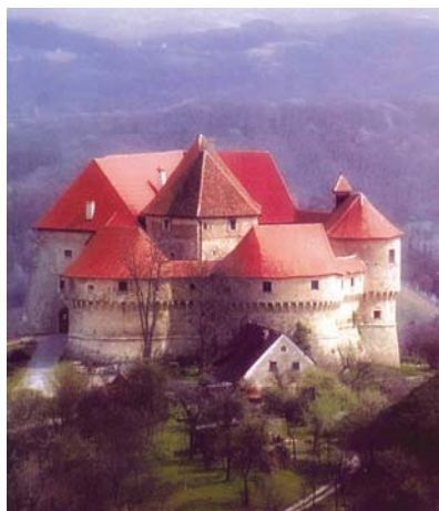
Pogled na Veliki Tabor

vrlo strmo brdo južno od uskoga šumskog puta, znajući iz literature da se iz Gračanice vrlo dobro vidi sve do Save. Kad smo se popeli na vrh ustanovili smo da se utvrda nalazi na drugom i nešto višem brdu, sa sjeverne strane puta, pa su nas stoga čekali silazak i ponovni uspon. Neke utvrde pamtim i po drugim nedaćama. Takav je primjerice posjet slavnom Cetingradu (br. 11/2002.) do kojega nije teško doći, ali je prilično udaljen od sadašnjeg naselja. Dok smo ga pronašli iznenada se spustila takva magla da se u utvrdi nije mogao uočiti ni snimiti čak ni zid udaljen desetak metara. Slična se