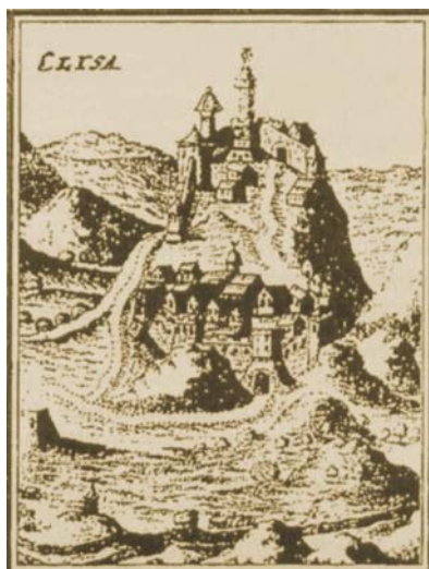
Jedan od najstarijih crteža Klisa s početka 16. st.

đivanju granica Hrvatskog Kraljevstva od 16. do 18. stoljeća . On je inače