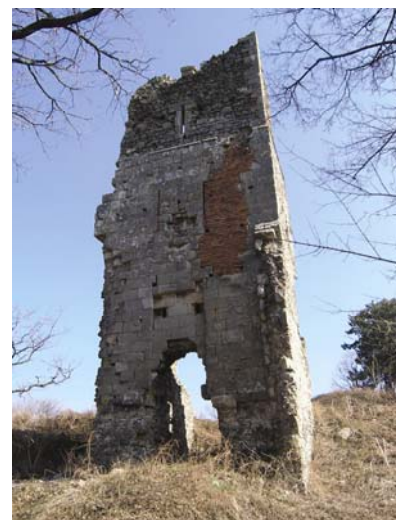
Ostaci utvrde Bedemgrad

Jedna od slabosti serije potaknuta je glavnim izvorom – knjigom Gjure