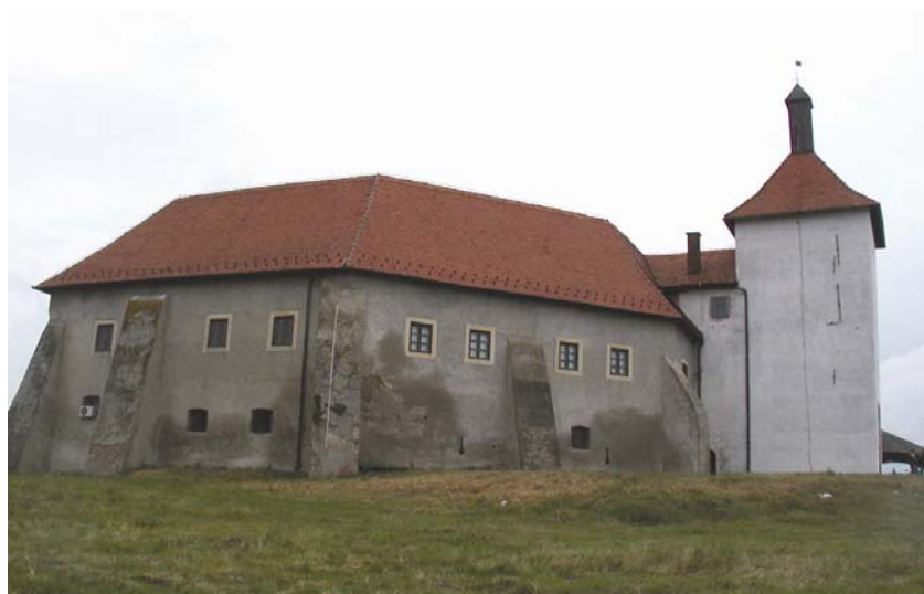
Pogled na utvrdu u Đurđevcu

Serija je započela primjerima iz južnih dijelova Hrvatske, da bi završila s istočnom Slavonijom i Srijemom. Bio je to ujedno i svojevrsni prikaz burne hrvatske povijesti, doduše malo nesustavan i skokovit, lišen bilo kakve kronologije jer su se izmjenjivale utvrde iz različitih razdoblja. Ipak prikazali smo junačka djela brojnih hrvatskih i austrijskih vojskovođa i komandanata, ali i onih s turske strane. Od naših junaka valja posebno spomenuti Petra Kružića (br. 9/2001.), Ivana Lenkovića (br. 1/2002.), Lavala Nugenta (br. 3/2002.), Tomu Bakača Erdödyja (br. 7/2003. i br. 9/2003.), Eugena Savojskog (br. 5/2005.) i Nikolu Iločkog (br. 9/2005.). Dakako da valja istaknuti i slavne Frankopane i Zrinske o kojima smo pisali u mnogim nastavcima. Upoznali smo tako Nikolu IV., prvog Frankopana (br. 3/2002., br. 5/2002.), neukrotivog Bernardina (br. 8/2002. i br. 9/2002.) i violentnog Vuka (br. 10/2002.), a obradili smo i nesretnu sudbinu Frana Krste Frankopana te "rodbinske veze" dviju grana Frankopana u Italiji i sadašnje svojatanje njihove slavne uspomene (br. 3/2003.). Dakako da smo u više navrata spominjali i slavne Zrinske, posebno sigetskog junaka Nikolu IV. Šubića Zrinskog (br. 3/2003., br. 5/2003., br. 6/2003., br. 3/2003. i br. 5/2004.),