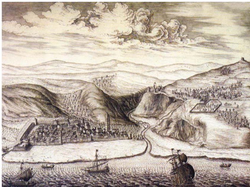
Rijeka i Trsat na crtežu M. Stiera iz 1660.

nute su još 102 utvrde od kojih smo neke također obišli. Ponekad su to bili pravi planinarski podvizi koji su zahtijevali mnogo upornosti i kondicije, a nerijetko su vozači sa svojim vozilima morali lutati po neprikladnim i teško prohodnim šumskim puteljcima. U pronalaženju nepristupačnih utvrda služili smo se planinarskim markacijama (često smo se uvjerali da se olininari jedini stvarno brinu o tom dijelu naše baštine), nešto rjeđe planinarskim kartama, a često i