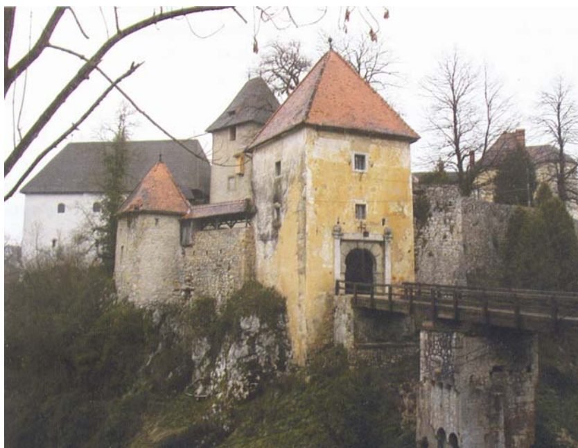
Ulaz u ozaljsku utvrdnu

Neke utvrde ipak nismo nikako uspješni pronaći i nakon više pokušaja. To je primjerice bio pokušaj pronalaska ostataka Opoja iznad Rasinje (br. 9/2004.). Slično je bilo i za pokušaj pronalaska Bijele Stijene i Cukovca (br. 11/2004.) ili Dobre Kuće i Stupčanice (br. 3/2005.). Tome je pomalo pridonio i strah od zaostata-