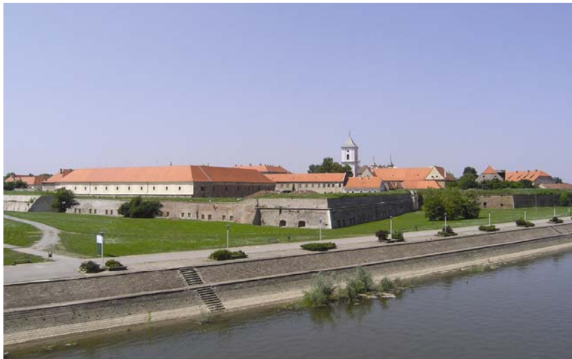
Pogled na osječku tvrđu s mosta preko Drave

Velikom Kalniku ništa ne treba dodavati, valja samo što više poticati posjetitelje te što agresivnije nuditi priče o "Crnoj kraljici" i plemićima "šljivarima". Za ostale bi nestale pro-