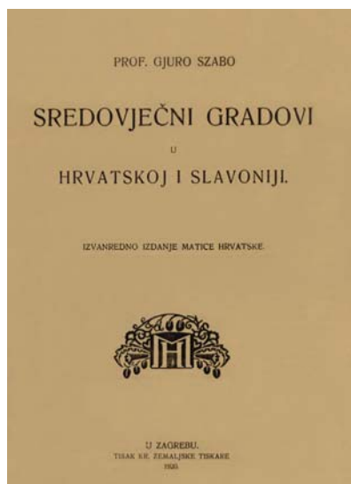
Naslovnica knjige Gjura Szabe o utvrdama u Hrvatskoj i Slavoniji

dogodila. Uostalom neke utvrde o kojima Szabo piše više se ne mogu ni pronaći niti utvrditi mjesto na kojemu su se nalazile.