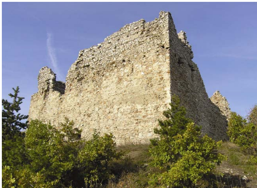
Trokutasta kula utvrde Velika

Bilo bi mnogo bolje kada bi se naše utvrde kategorizirale s obzirom na