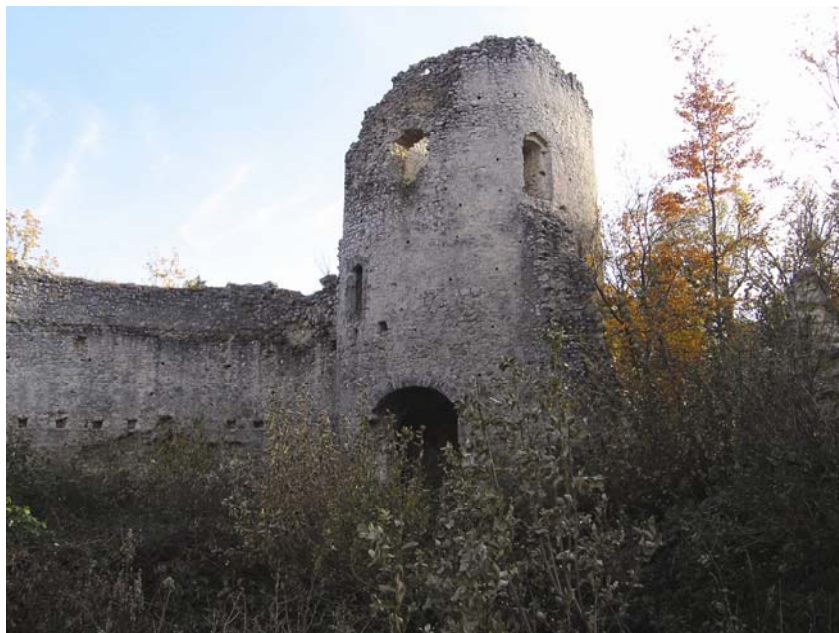
Okrugla ulazna kula utvrde Gračanica

slavom ovjenčanog i u lovu strada-log Nikolu VII. (br. 3/2003., br. 5/2004. i br. 7/2005.) te nesretnog bana Petra (br. 2/2002., br. 3/2003. i br. 5/2004.). Valja podsjetiti i na slavne turske vojskovođe Ulama-pašu, Malkoč-bega, Ferhad-pašu Sokolovića, Gazi Husrev-bega, Mehmed-bega Jahjapašića, Murat-bega Tardića i Hasan-pašu Predojevića Došena koji su se često spominjali, ali i detaljnije obrađivali (br. 5/2003., br. 6/2003., br. 8/2004., br. 11/2004. i br. 1/2005.).