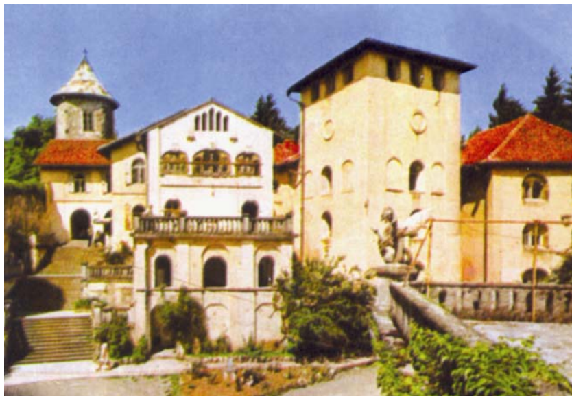
Utvrda i dvorac Bosiljevo iz doba kada je bio restoran i prenočište

Dobro pamtim i uspon na Oštrc, inače najvišu utvrdnu Ivanščice, na kojemu smo bili nešto prije (br. 12/2003.). Do nadomak utvrde dovezli smo se