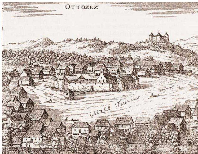
Otočac na crtežu J. W. Valvasore