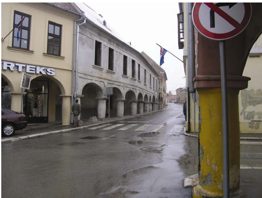
Sadašnji izgled zgrade Diližanske pošte

stveni, izložbeni i muzeološki rad. To se osobito očitivalo u brojnim stalnim i povremenim izložbama. Posebno se ističu izložbe: Vučedol – treće tisućljeće prije Krista (Muzejski prostor u Zagrebu 1988.), izložba umjetnina iz Zbirke Bauer (Muzejski prostor u Zagrebu 1989.) i izložba u povodu 100. obljetnice rođenja nobelovca Lavoslava Ružičke (izložba u prostorijama HAZU u Zagrebu 1987.). Aktivnost se bila višestruko razvila, a zbirke su povećane i proširene.