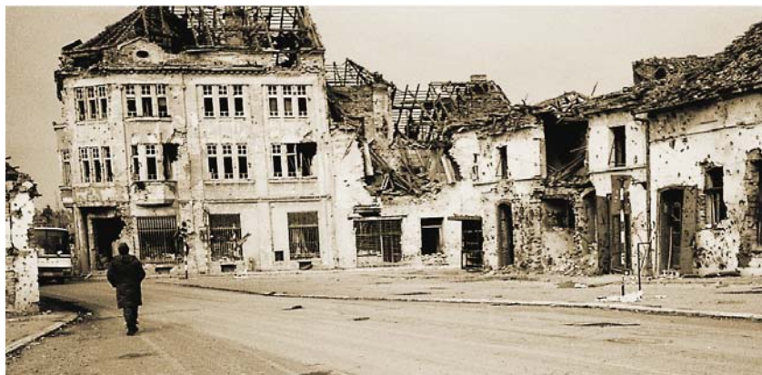
Zgrada Zbirke Bauer 1992.

Prijeratna zgrada Zbirke Bauer, koju mnogi u Vukovaru bolje poznaju kao negdašnje sjedište Službe državnog knjigovodstva ( SDK ), bila je dvokatna reprezentativna palača izgrađena 1922., a polovicom osamdesetih godina prošlog stoljeća zajedno sa susjednom zgradom Malog kina bila je određena za trajni smještaj Zbirke Bauer. Bilo je to u vrijeme kada je s lijeve strane Vuke izgrađena nova zgrada SDK , danas Fine i