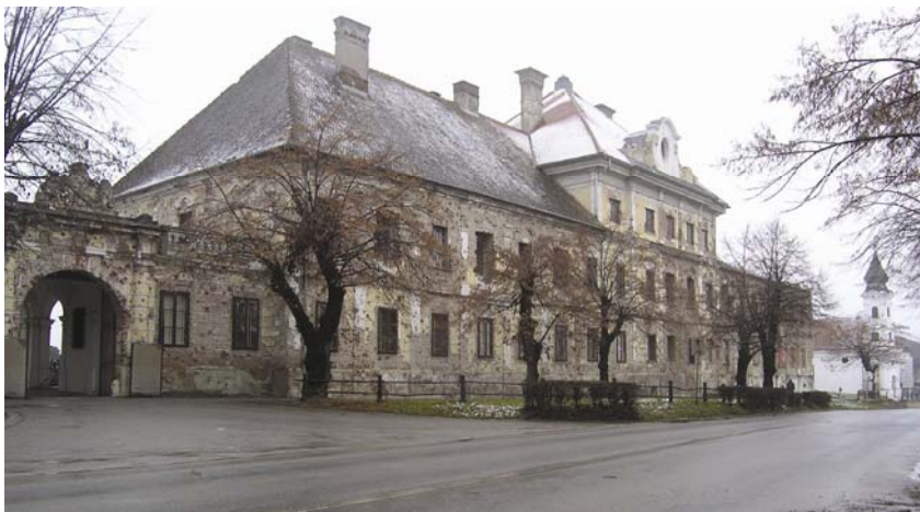
Sadašnji izgled dvorca Eltz