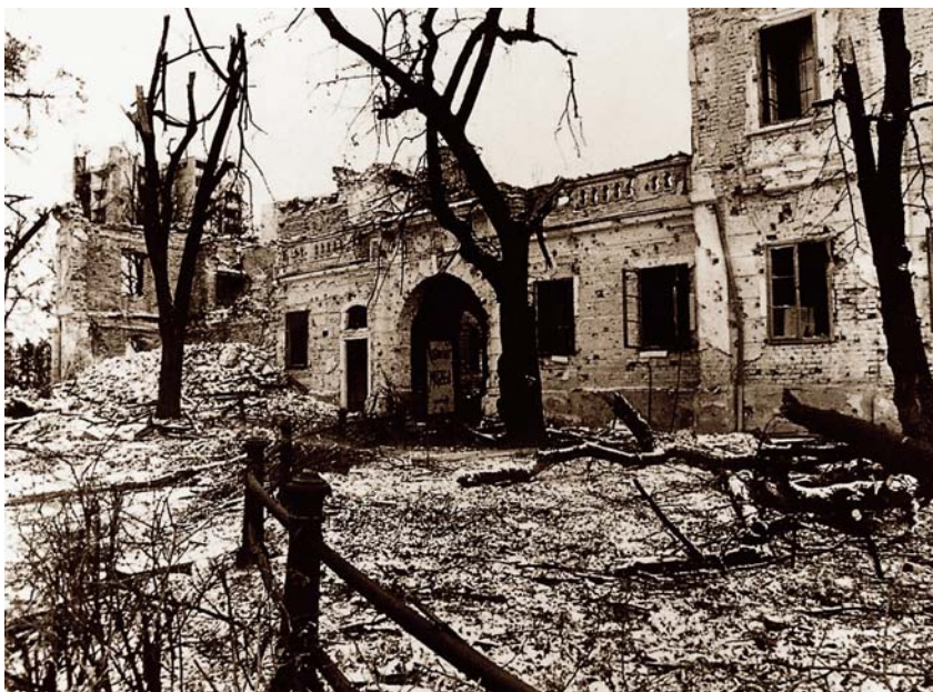
Dvorac Eltz snimljen 1991.

Glavno se pročelje jednokatnog dvorca proteže uz uličnu liniju, a graciozno je dvorišno pročelje, s istaknutim dvokatnim središnjim rizalitom, okrenuto romantičarski oblikovanom perivoju koji se protezao do ušća Vuke i obale Dunava.