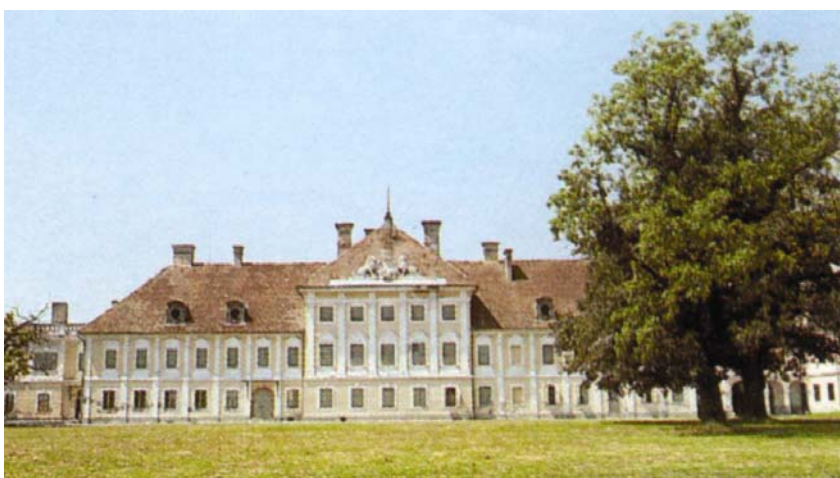
Dvorac Eltz prije rušenja

Dvorac grofova Eltz jedan je od najuočljivijih urbanih sadržaja Vukovara i međunarodno poznati spomenik kulture. Smješten je u glavnoj ulici novog Vukovara, sadašnjoj Županijskoj ulici. U izvornom je obliku građen između 1749. i 1751. kao jednostavan ranoklasicistički dvorac. S jačanjem vlastelinstva i dvorac se razvijao višekratnim pregradnjama i dotjerivanjima. Raskošna neobarokna pročelja u doba kasnog historizma izveo je od 1895. do 1907. bečki arhitekt Viktor Sidek.