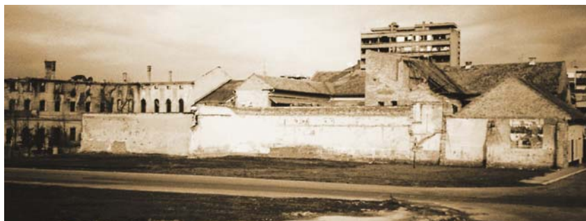
Mjesto na kojem je bila zgrada Zbirke Bauer snimljeno 1995.

noj vukovarskoj jezgri već obnavlja. To je zgrada tzv. Diližansne pošte u kojoj je od 1948. djelovao Gradski muzej, a poslije od 1966. Zbirka Bauer. Ta je zgrada zaštićena kao spomenik kulture visoke kategorije, a pripada kasnom baroku i dio je cjelovitog sklopa međusobno povezanih jednokatnica s masivnim trijemovima. Nastala je u drugoj polovici 18. st. spajanjem triju susjednih kuća. U prizemlju su oduvijek bili smješteni javni sadržaji, a na katu su prije bili stanovi. Od kuća u sklopu ova se zgrada razlikuje po tome što je sa svojih osam lučnih otvora najveća, a u izvornom je obliku imala i najbolje uređeno pročelje. Nakon II. svjetskog rata u kući je, kao što je već rečeno, bio Gradski muzej, potom Zbirka Bauer i galerija umjetnina. U novije je vrijeme u prizemlju bio uređen prostor za povremene izložbe.