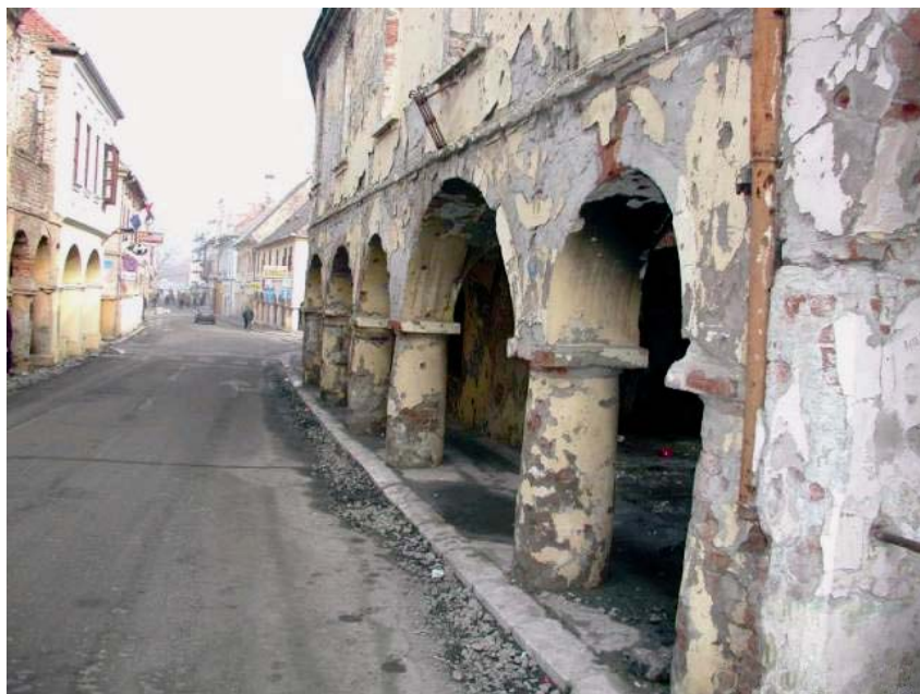
Zgrada Diližansne pošte prije obnove

S vremenom je Muzej postao nezaobilazna kulturna institucija za znan-