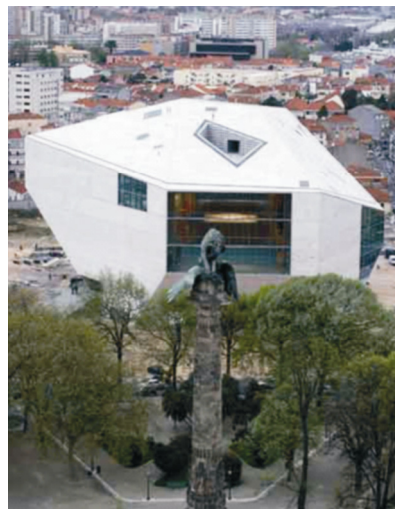
Vanjski izgled zgrade Casa da Musica

Zgrada je otvorena u travnju 2005. svečanim koncertom rock glazbenika Lou Reeda. Casa da Musica je građevina u kojoj će se održavati koncerti klasične, pop i rock glazbe, jazza te eksperimentalne i elektronske glazbe.