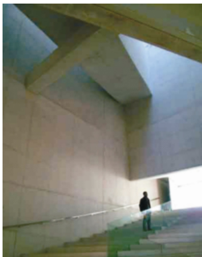
Zakošeni stropovi stvaraju zanimljivu igru svjetla i sjene u interijeru

kreirao, specijalno za ovu zgradu, dizajner Maarten van Severen. Pored malog auditorija crvenih zidova, u građevini se nalazi više malih foàjea, čiji su podovi popločeni pločicama,