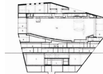
Presjek istok – zapad