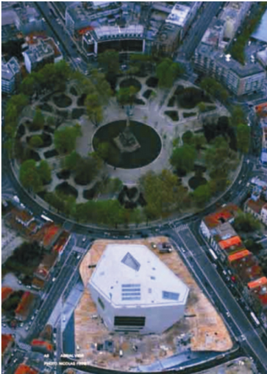
Položaj nove građevine uz park Rotunda da Boavista

Pošto je portugalski grad Porto izabran kao jedan od dvaju glavnih kulturnih gradova Europe za 2001., ministar kulture i grad Porto osnovali su Porto 2001 , organizaciju koja je