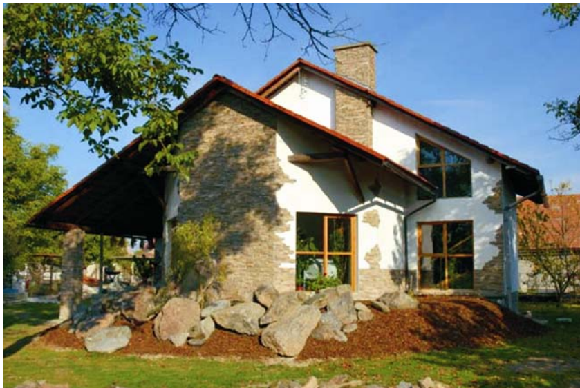
Slika 1. Obiteljska kuća u okolici Beča sa zidovima od slame

zuzu da je zid ispunjen balama slame mnogo otporniji na požar, nego zid drvenog postolja uz jednake završne slojeve [2].