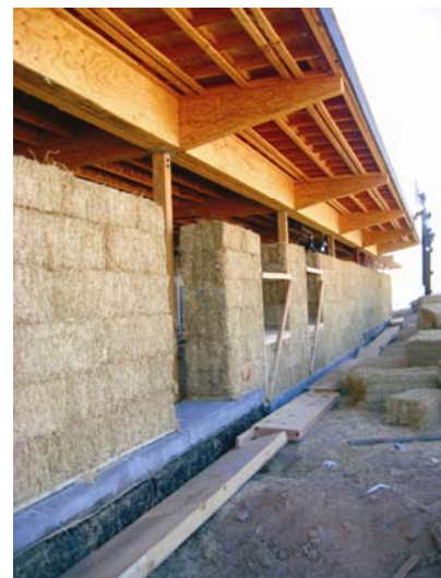
Slika 2. Kuća sa slamnatim zidovima u gradnji

Iako se slama u Hrvatskoj danas smatra otpadom, može biti vrlo jeftin građevni materijal. Isporučena bala slame s polja stoji u prosjeku samo 1 ili 0,5 eura, dok zidovi obiteljske dvokatne kuće od otprilike 150 m 2 stoje samo otprilike 900 eura, što je zaista malo u usporedbi s cijenom zidova od opeke i blokova koji stoje otprilike 15000 eura. Budući da je način gradnje kuće od slame tako jasan, u projektiranju i gradnji mogu sudjelovati ljudi bez prethodnog iskustva, štedeći tako na troškovima rada.