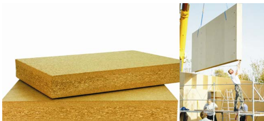
Slika 4. CP blokovi s prikazom njihove ugradnje

Različite vrste slame imaju različite kemijske sastave i svojstvene čvrstoće. Međutim, mikrosvojstva slame manje su važna od makrosvojstva bale. Prema iskustvu i nekim laboratorijskim ispitivanjima, sadržaj vlage, gustoća i povijest (povijest skladištenja bale i zaštita od žetve do gradnje) primarni su odlučujući faktori koji utječu na kvalitetu bale [6]. Sadržaj vlage ovisi o uvjetima u vrijeme baliranja i prilikom kasnijeg skladištenja i transporta. Kontrola kvalitete i ispitivanje bale slame zahtijeva upotrebu vlagomjera. Gustoća bale ovisi o vrsti žitarica, sadržaju vlage i stupnju kompresije balirke, ali općenito bi trebala iznositi najmanje 1,1 kN/m 3 (suha gustoća je gustoća kojoj je proračunata i oduzeta masa vlage) ako se namjerava rabiti kao nosivi element. Veličina bale varira ovisno o balirkama koje se upotrebljavaju lokalno iako je standard za trižičane bale 584 x 1168 x 406 mm (dvožičane bale su puno manje). Prema različitim laboratorijskim ispitivanjima slamnate bale ustanovljen je modul elastičnosti 1379 kPa (ovisno o gustoći i vlazi) i tlačno naprezanje od 482,7 kPa. Neožbukani zidovi visine 2438 mm prema ispitivanjima na tlak izdržali su (prije izvijanja zida) tlačna naprezanja od 27,6 do 34,5 kPa. Na slici 5.