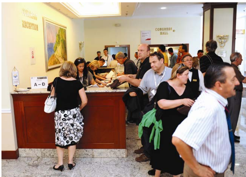
Prijave sudionika na recepciji