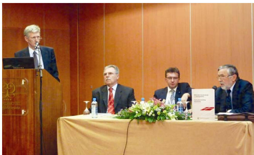
Predstavljanje knjige Betonske konstrukcije u visokogradnji