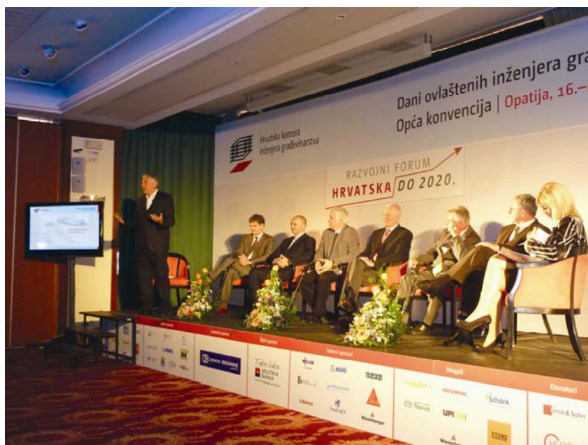
Sudionici panel-diskusije o razvojnim projektima

Program je inače predstavljen vrlo efektivno jer su u panel diskusiji koju