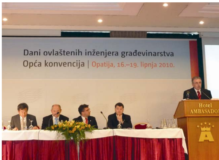
Detalj sa seminara Tunnels and Underground Structures