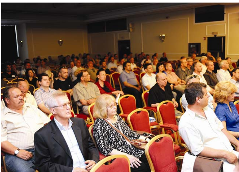
Sudionici Opće konvencije na Danima ovlaštenih inženjera

Prva su njegova stručna iskustva povezana s projektom Opuzen – Ušće u Donjoj Neretvi. To je dragocjeno iskustvo izravno utjecalo na njegovu profesionalnu karijeru jer je projekt bio sufinanciran od FAO, a vodili su ga međunarodni eksperti. Potom je do 1983. radio je u građevinskoj operativi, u Hidroelektri i Industrogradnji , kao voditelj radova i glavni inženjer. U Industrogradnji je od 1976. bio direktor razvitka, operative i inženjeringa te pomoćnik generalnog