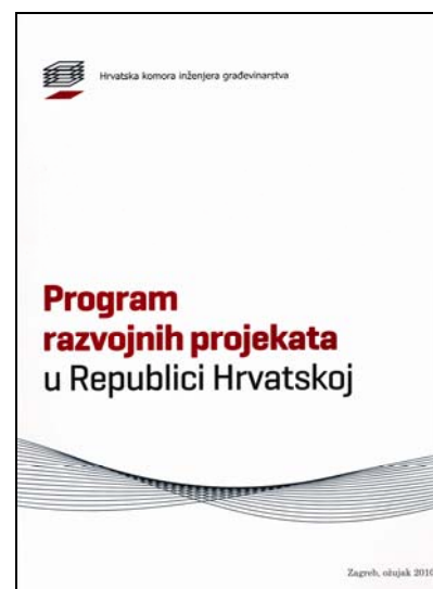
Naslovna strana knjige o razvojnim projektima