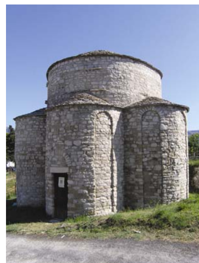
Crkva Sv. Trojice u Splitu

Ipak sve te klasifikacije ne mogu objasniti pojavu mnogih crkava s kružnom osnovom, a posebno desetak šesterokonznih čije je postojanje potvrđeno. Riječ je Sv. Trojstvu u Splitu (sačuvana u cijelosti), Stomorici u Zadru, Kašiću, Pridragi i Bribiru te u Trogiru, Zadru (Sv. Kerševan), Kakmi i Brnazama o kojima