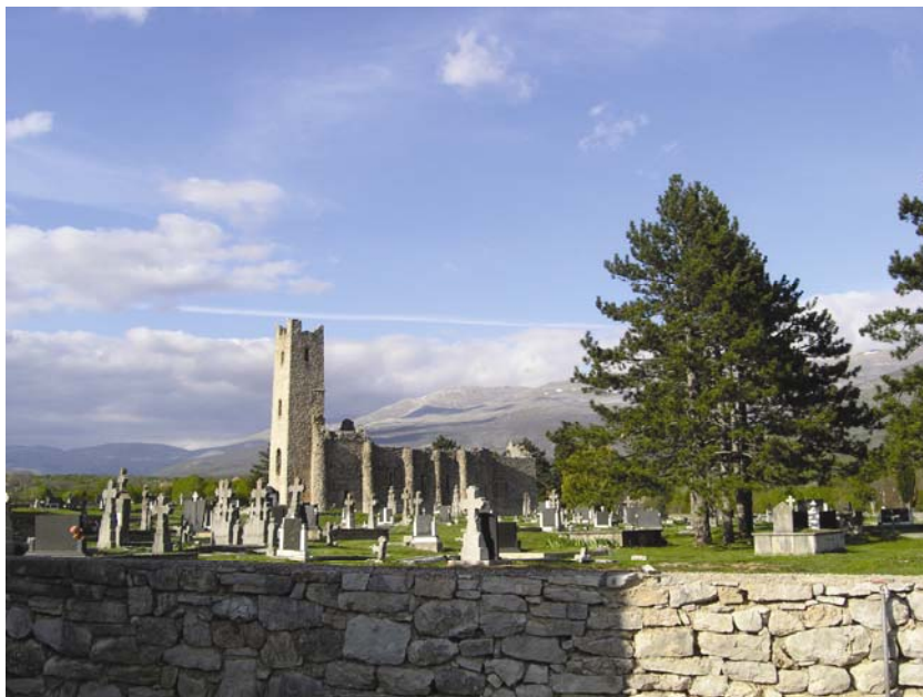
Predromanička crkva Sv. Spasa na vrelu Cetine

Ipak zbuñuje velika skupina šesteroapsidnih crkava koje se nalaze u gradovima Zadru, Trogiru i Splitu te u njihovu zaleđu, a gotovo su sigurno građene u 9. st., za jakoga karolinškog utjecaja u Hrvatskoj, posebno što sve imaju kupolu, često i s tamburom, a to opet upućuje na bizantsko podrijetlo. Tvrdnje da su nastale po ugledu na zadarsku krstionicu ne djeluju previše uvjerljivo, kao ni da su građene uz samostane ili uz kraljevske i kneževske dvorove. Još su tajanstvenije osmerokonhne crkve (u Ošlju, vjerojatno Bribiru, a možda i Biskupiji kod Knina) koje su prava svjetska rijetkost i nastanak kojih je potpuna zagonetka, posebno stoga što je crkva nepoznatog titulara u Ošlju (kao i Stomorica u Zadru) imala, kako se čini, zapad-