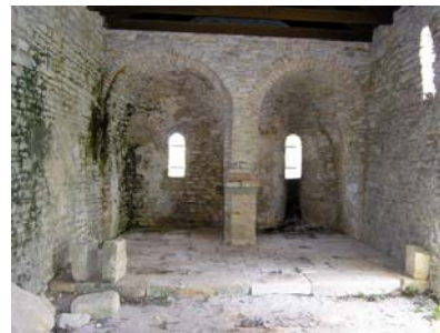
Unutrašnjost dvoapsidne crkve Sv. Marije Male u Balama

Petar Stari). Tu je najznačajnije otkriće središnje male niše između apsida u crkvi Sv. Marije Male u Balama kao graditeljsko i liturgijsko središte crkvenoga prostora. Dosad se vjerovalo da su dvoapsidne crkve svojevrsni odjek starokršćanskih dvojnih crkava i da je namjena apsida bila različita, a sa središnjom makar i minijaturnom apsidom sve ima drugi smisao.