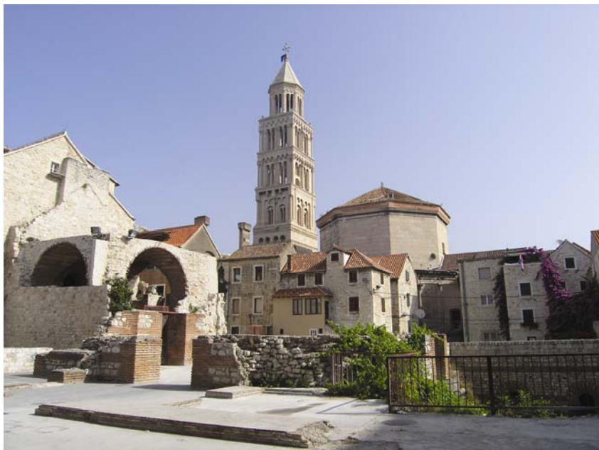
Crkva Sv. Dujma u Splitu

razmjerno malo predromaničkih, ali zato mnogo starokršćanskih i ranoromaničkih crkava. No svakako valja istaknuti da ukupan broj svih starokršćanskih, predromaničkih i ranoromaničkih crkava od 808 zaista dojmljiv, a posebno 455 crkava za koje postoje materijalni dokazi i od kojih je 110 pod krovom.