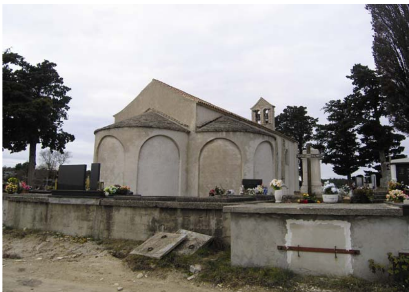
Crkva Sv. Martina u Pridrazi

apsidama, a gotovo da su zastupljene svi poznati tipovi crkava koji se sreću na području negdašnjega Zapadnoga Rimskog Carstva. Postoji nekoliko dokazanih kućnih crkava (Salona i eventualno Zadar i Poreč, a možda i Pula), a otkriveno je i mnogo dvojnih crkava, neovisno o tome jesu li bile spojene ili odvojene (Salona, Srima, Nezakcij, Pula, Poreč...). Za te se crkve vjeruje da je jedna služila za javne obrede, a druga kao memorija za svetačke moći, ali se ipak pouzdano ne zna njihova liturgijska namjena i potreba. No svakako valja istaknuti velike gradske bazilike kojih je bilo u gotovo svim biskupskim središtima (Naroni, Zadru, Skradinu, Rabu, Osoru, Poreču...). Pronađeno je i dosta trikonhosa (Sutivan, Pridraga, Bilice...), neobičnih jednobrodnih crkava s tri apside od kojih su bočne nasuprotne i koje su možda prethodile transeptu ili su iz njega proizašle. Ima dakako