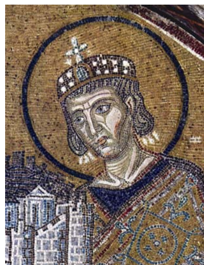
Konstantin I. Veliki (306.337) na mozaiku crkve Aje Sovije u Istanbulu

lo romanizaciji i jačanju Rimskoga Carstva. Konstantin I. Veliki (306.-337.) Milanskim je ediktom 313. proglasio kršćanstvo vjerom, a potom je 330. unaprijedio Bizant u novu prijestolnicu koja se po njemu zove Konstantinopol. Iz tog je sjedišta istočnim i zapadnim područjima vladao drugi rimski car kada je posljednji car Zapadnog Rimskog Carstva zbačen 476. godine. Istočno je Rimsko Carstvo odnosno Bizant i dalje postojalo i postupno se smanjivalo, sve do 1453. kada su Turci osvojili Konstantinopol. Valja reći da je već 381. car Teodozije I. Veliki (379.-395.) proglasio kršćanstvo službenom rimskom religijom.