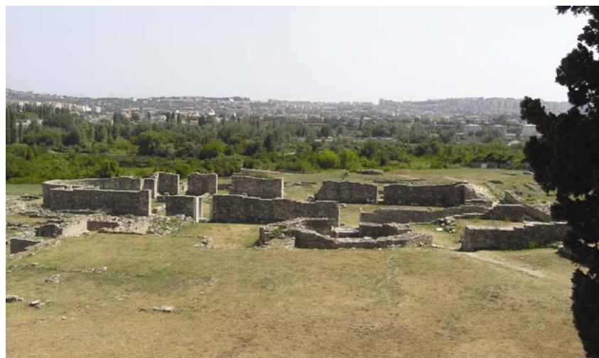
Dio biskupskog središta u Saloni (u pozadini zgrade Solina i Splita)

katedrale Sv. Dujma u Splitu. Tko primjerice u svijetu zna, osim uskog kruga stručnjaka, da je Sv. Donat u Zadru nastao po ugledu na dvorsku kapelu u Achenu i da je druga po veličini crkva u svijetu izgrađena u 9. st. Osim toga ona je izvorna i po tome što ima tri apside te prstenasti brod na katu. O tome donedavno nije bilo spomena čak ni u znanstvenim publikacijama.