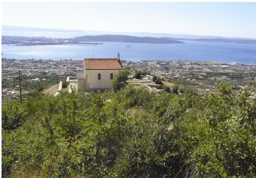
Crkva Sv. Jurja u Putalju iznad Kaštel Sućurca

Treba još reći da jedan broj teoretičara drži da postoji neprekinuti kontinuitet između starokršćanskih i predromaničkih crkava, a iz antike uostalom potječe i pleterni reljef kojega se zbog brojnosti dugo držalo prepoznatljivom hrvatskom posebnos-