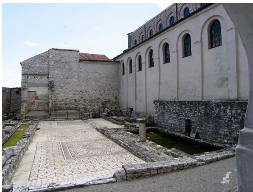
Ostatci starijih crkava uz Eufrazijevu baziliku u Poreču

kođer smo zanemarili činjenicu da su mnoge crkve nakon rane romaničke temeljito preuređivane i dograđivane.