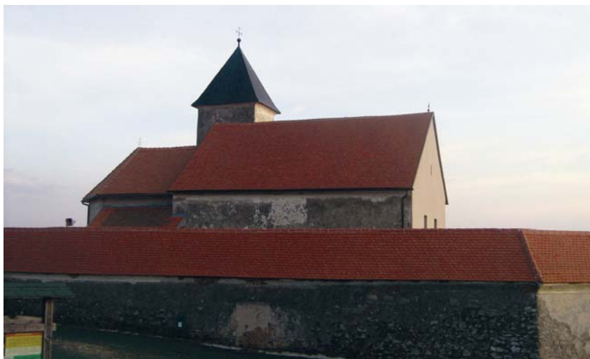
Sadašnja crkva Sv. Marije Gorske u Loboru

Čitajući brojne članke i knjige uočili smo relativno često nepoznavanje nekih graditeljskih pojmova, posebno brkanje lukova i svodova. Najmanji je problem bio relativno često poistovjećivanje žbuke i morta, ali smo se u jednom slučaju znatno namučili u potrazi za značenjem pojma "baldehinski svod". Poznato je da postoji nekoliko vrsta svodova, kao što su bačvasti, križni, križno-rebrasti, zvjezdasti, mrežasti, lepezasti i zrcalni te kupola koja je svod u obliku šuplje polukugle. Osim kupole u crkvama o kojima smo pisali rabili su se samo bačvasti (povezani prostor između zidova ili stupova koji tvori kontinuirani polukružni svod) i križni svodovi koji nastaju poprečnim presijecanjem dvaju bačvastih svodova. Kako se križno-rebrasti svod sa šiljastim lukovima, a koji bi možda sličio "baldehinskom svodu", pojavljuje tek u doba gotike, tražili smo objašnjenja na crtežima i fotografijama i ustanovili da se ipak radi o "jednostavnom" bačvastom svodu.