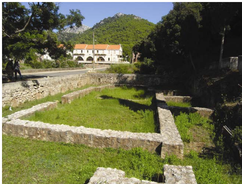
Ostaci starokršćanske crkve Sv. Petra na Lastovu

ali zbog ubijanja zmaja i ilirska svetišta jer je zmija bila jedno od ilirskih božanstava. Sv. Petar će zbog