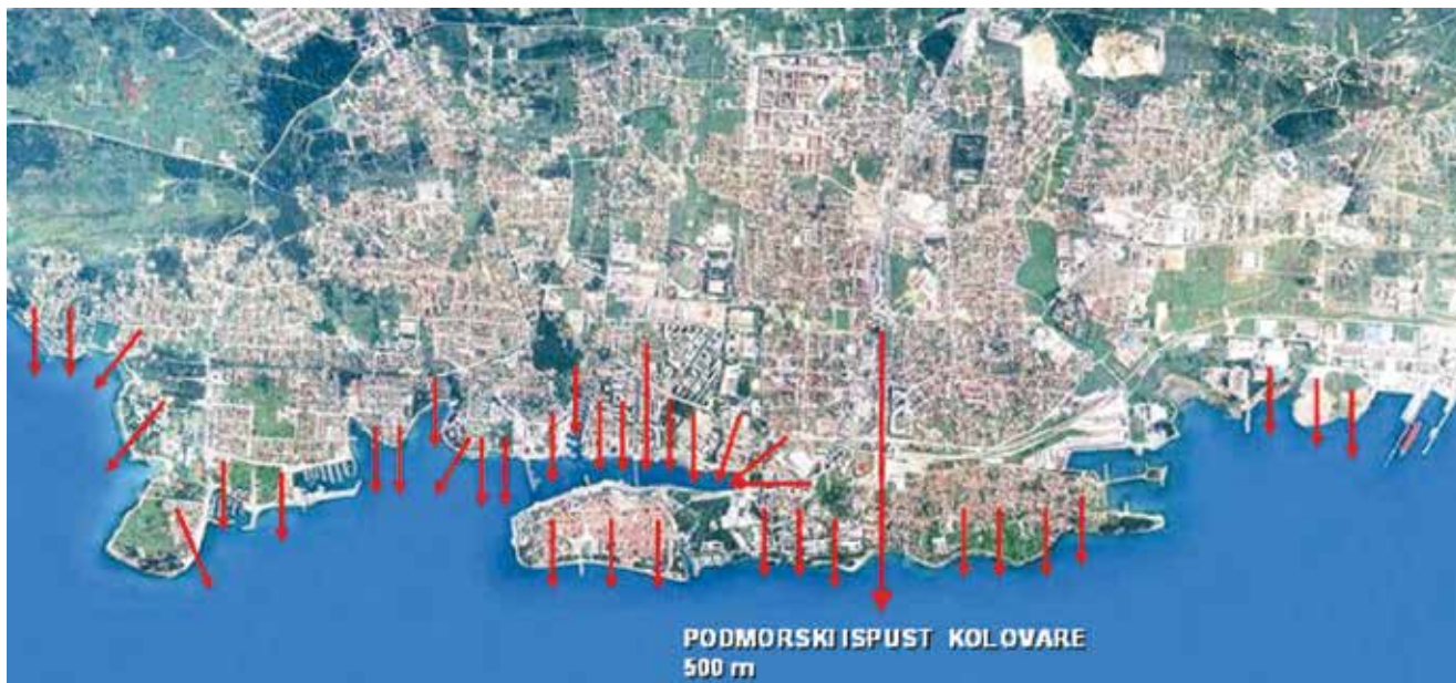
Stanje odvodnje prije gradnje uređaja za pročišćavanje otpadnih voda

Pripreme za osmišljavanje i gradnju suvremenoga zadarskog sustava odvodnje otpadnih voda započele su još u osamdesetim godinama prošlog stoljeća. Tada je prema studijama i idejnim rješenjima zaključeno to da problem odvodnje treba riješiti dvama odvojenim kanalizacijskim sustavima s posebnim uređajima za pročišćavanje. Razlozi za takvo rješenje bili su prirodne značajke terena, postojeća i planirana urbana izgradnja i stanje izgrađenosti kanalizacijske mreže za koju je prihvaćena etapna izgradnja. Na to su znatno utjecali i položaj i osobine Zadarskog kanala kao