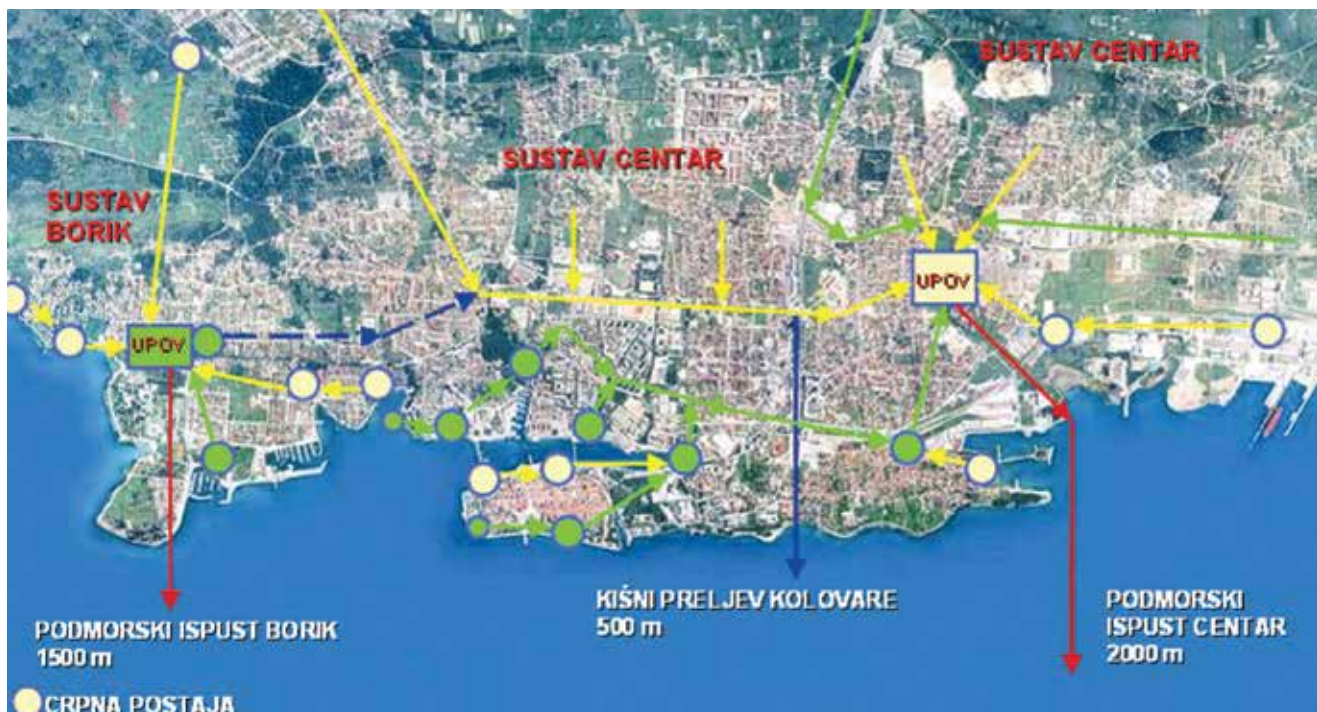
Prikaz stanja zadarske odvodnje otpadnih voda nakon završetka svih radova

Na lijepo i skladno uređenome prostoru UPOV-a posađene su i mlade masline. Redovite su i berbe, a laboratorijska su ispitivanja pokazala da se radi o ekstra djevičanskom ulju. S obzirom na to da je riječ o malim količinama, prikladno ih pakiraju i poklanjaju poslovnim partnerima.