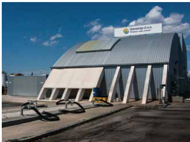
Glavna ulazna građevina za pročišćavanje