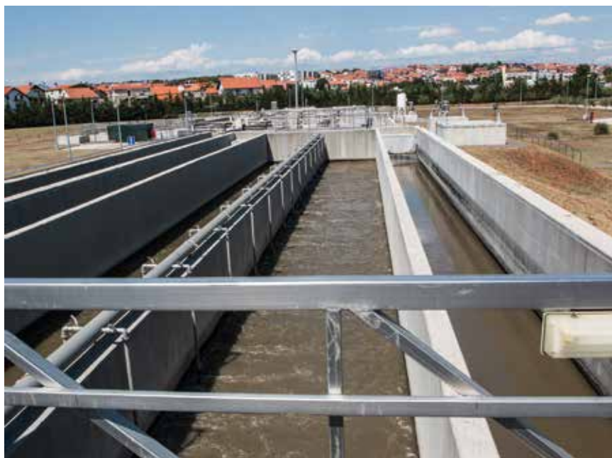
Pogled na pjeskolov/mastolov u radu

Uređaj je, kao što je spomenuto, projektiran za drugi stupanj pročišćavanja i za 100.000 ES, ali je odmah rezerviran prostor za njegovo proširenje na 200.000 ES