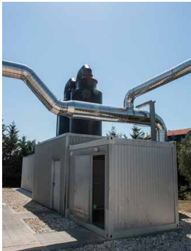
Uređaj za pročišćavanje zraka i uklanjanje neugodnih mirisa

U nastavku otpadna voda stiže do naknadnih taložnika gdje se bistri prije ispuštanja u recipijent. U prvoj su fazi također izgrađena tri naknadna taložnika sa zajedničkim pokretnim mostom za zgrtanje istaloženog mulja na dnu. Duljina je triju blokova naknadnih taložnika 58 m, a širina 6 m. Mulj se iz svih naknadnih taložnika može evakuirati u stanicu za povratak (recirkulaciju) aktivnog mulja ili kao višak u zgušnjivače.