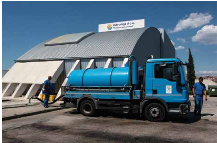
Kamion koji dovozi sadržaje septičkih jama

U sklopu je uređaja i laboratorij za pogonske analize i upravljanje tehnologijom pročišćavanja. Sastoji se od fizikalno-kemijskog i mikrobiološkog dijela, dijela za vaganje te pomoćnih prostorija. Svaki se radni dan uzimaju uzorci i analiziraju sirova i pročišćena otpadna voda te aktivni i dehidrirani mulj. Fizikalne analize obuhvaćaju pH, otopljeni kisik, provodljivost