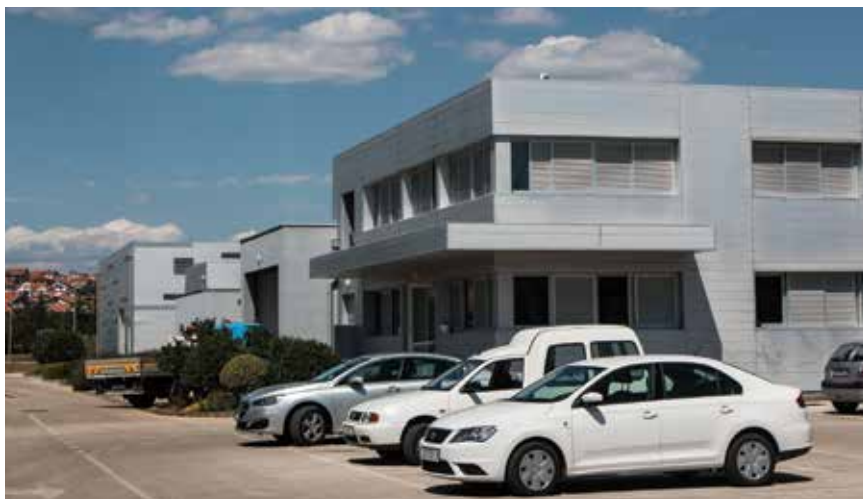
Upravna zgrada uređaja Centar

Jadranu, zajedno s jednom lokacijom pokraj Crikvenice.