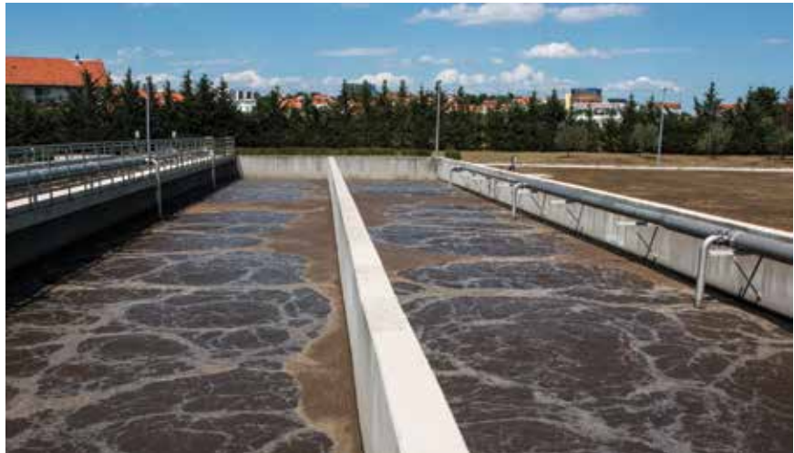
Otpadna voda u sekundarnim taložnicima

Slijedi stanica za prihvat sadržaja septičkih jama koja ima ukopani sabirni ar-