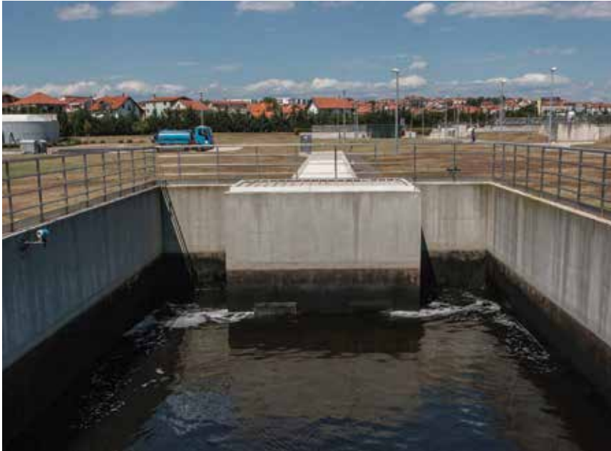
Pročišćena voda prije ispuštanja u more

mulj koji se prikuplja u crpnoj stanici za recirkulaciju i vraća u bioaeracijski bazen, a višak mulja odvodi u zgušnjivače mulja i na daljnju obradu. Aeracija se obavlja upuhivanjem i raspršivanjem zraka s pomoću membranskih aeratora. U dva se naknadna taložnika, koja su povezana pokretnim mostom zgrtača mulja, voda bistri, a postupak traje približno tri i pol sata. Mulj se iz tih taložnika odvodi u crpnu stanicu iz koje se dio odvodi u zgušnjivače, a dio recirkulira pužnim crpkama. U te se zgušnjivače uvodi primarni i sekundarni mulj tlačnim cjevovodom, a zgusnuti se crpi vijčanim crpkama na strojni uređaj za dehidraciju, gdje se iz njega uklanja višak vode i smanjuje njegov volumen. Dehidracijom se znatno povećava koncentracija suhe tvari mulja, čak i na 35 % dodavanjem živog vapna, i takav se "muljni kolač" odvozi na odlagalište. Dnevna se proizvodnja mulja kreće od 14 do 18 t/dan.