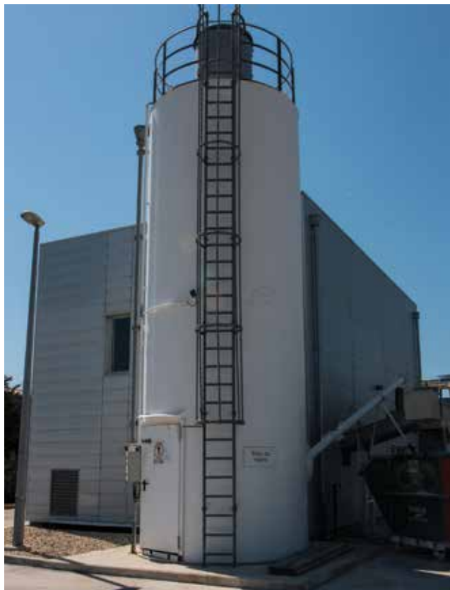
Postrojenje za obradu mulja i dehidraciju mulja