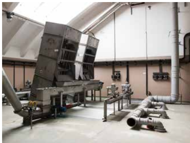
Detalj unutrašnjosti ulazne građevine

hrvatska projektantska tvrtka postala dijelom konzorcija za građenje.