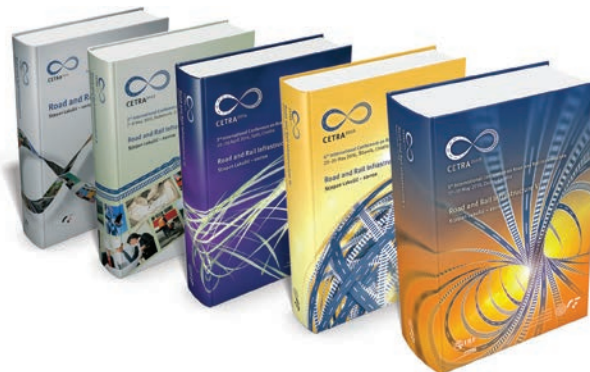
Svi zbornici konferencije CETRA

Na kraju ističemo kako je medijski pokrovitelj konferencije bio časopis Građevinar .