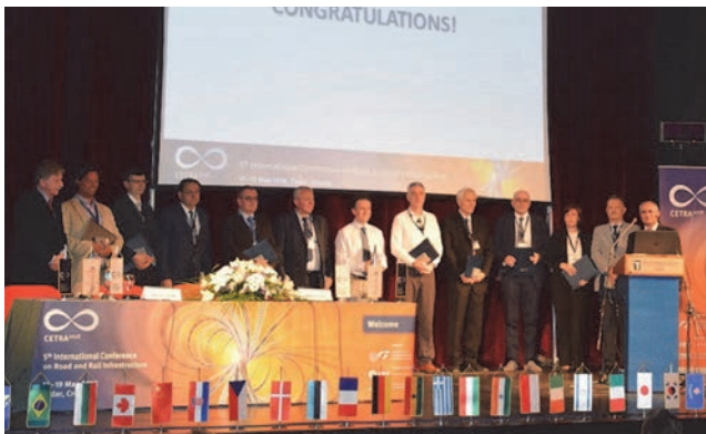
Nagrađeni članovi međunarodnog znanstvenog odbora CETRE