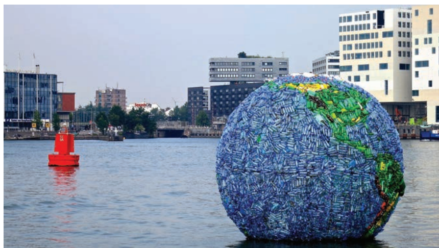
Plastični otpad jedan je od gorućih problema na planeti