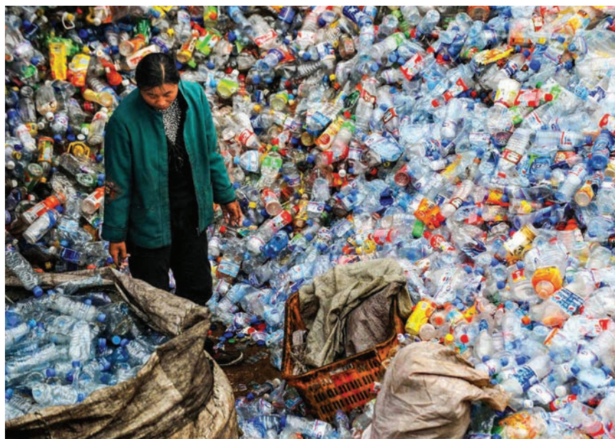
Siromašne zemlje moraju vraćati bogatim zemljama natrag kontaminiranu plastiku

Najveći izvoznik plastičnoga otpada na svijetu je Europska unija, a Sjedinjene Američke Države zauzimaju prvo mjesto na ljestvici pojedinačnih zemalja izvoznica