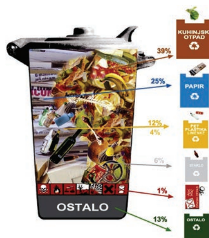
Otpad je sirovina za nove proizvode

Dakle, problemi su adresirani, a rješenja za održivo gospodarenje plastičnim otpadom su brojna. To su ponajprije kvalitetnije odlaganje i recikliranje, edukacija, odnosno podizanje razine svijesti, smanjivanje opsega proizvodnje i zabrana prodaje nepotrebnih proizvoda za jednokratnu upo-