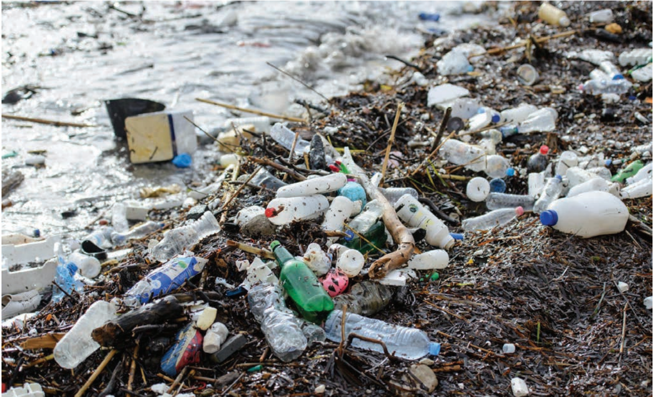
Relativno čest prizor s hrvatskih plaža

svih pronađenih predmeta bilo je plastičnog podrijetla. Životinje od toga umiru, a čestice mikroplastike poslije kroz hranu ili kuhinjsku sol završavaju i u ljudima. Ne čudi zato što je problem plastike već godinama jedna od važnijih tema u Europskoj uniji i prvi se put traži rješenje koje će na svim razinama riješiti jedno od gorućih ekoloških pitanja.