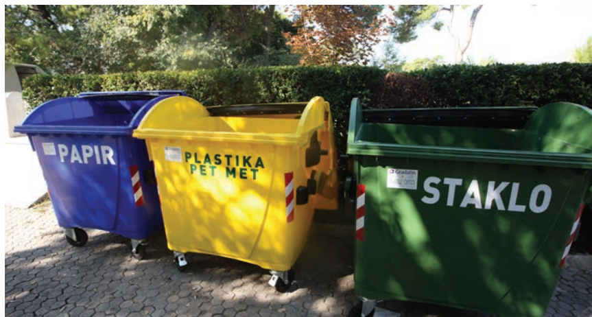
U Hrvatskoj se reciklira samo 21 posto komunalnog otpada

samo 21 posto komunalnoga otpada, dok je čak 78 posto komunalnoga otpada odlagano na odlagalištima (stopa je među najvišima u EU-u) bez ponovne primjene u svrhu recikliranja, kompostiranja ili neke nove vrste ponovne upotrebe. Hrvatska je tako svrstana među zemlje članice EU-a koje najmanje recikliraju, odnosno otpad tretiraju kao smeće, a ne kao sirovinu. Na temelju analize postojećih i ozbiljno planiranih politika u području gospodarenja otpadom smatra se kako postoji rizik da Hrvatska neće ispuniti cilj od 50 posto određen za 2020. u pogledu pripreme za ponovnu uporabu i recikliranje komunalnog otpada te je zaključeno kako odvojeno prikupljanje otpada koji se može reciklirati, uključujući biootpad, još uvijek nije učinkovito; da tek treba uvesti gospodarske poticaje za građane i općine; da u Hrvatskoj programima proširene odgovornosti proizvođača nisu sasvim pokriveni troškovi odvojenoga prikupljanja te su potrebna su dodatna ulaganja u projekte koji zauzimaju više mjesto u hijerarhiji otpada, odnosno u sklopu kojih se ne obrađuje samo preostali otpad. Komisija je u upozorenju izdala nekoliko preporuka Hrvatskoj koje bi joj trebale pomoći u izlasku iz zone rizika, među kojima su i prijedlozi da se bolje koriste sredstva iz ESI fondova te da se umjesto centara za gospodarenje otpadom sredstva usmjere i na sama kućanstva te na podršku građanima da odvajaju materijale za reciklažu i biootpad.