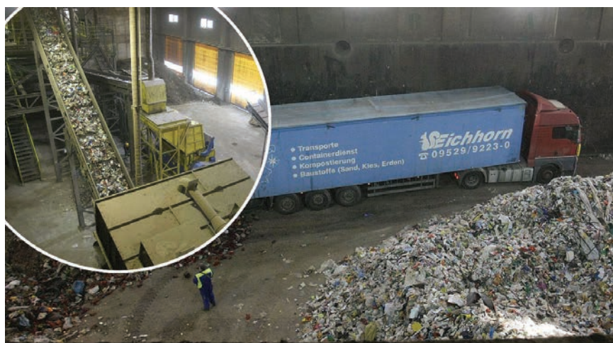
U Hrvatskoj je potrebno izgraditi nove skladišne prostore i sortirnice otpadne plastike

otpadom. Naime, gradsko komunalno poduzeće Čakom trenutačno uspijeva plasirati 45 posto prikupljene plastike. To je PET plastika koja se lako obrađuje, dok ostatak čini višeslojna i "prljava" plastika u koju treba uložiti više novca kako bi se ponovno iskoristila. Naime, nju nitko ne želi, zbog čega završava na odlagalištima otpada.