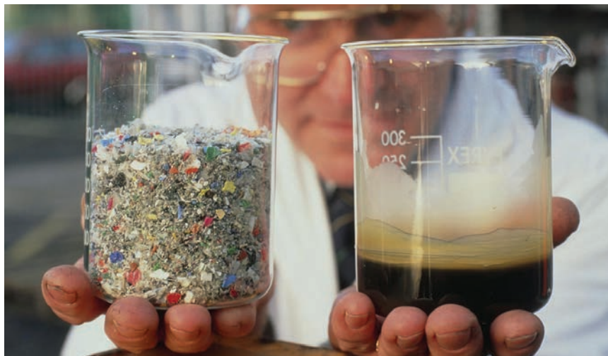
Otpadna plastika može se pretvoriti u gorivo

Problema s plastikom u Hrvatskoj ima napretek: prelamno razdvajamo pa na