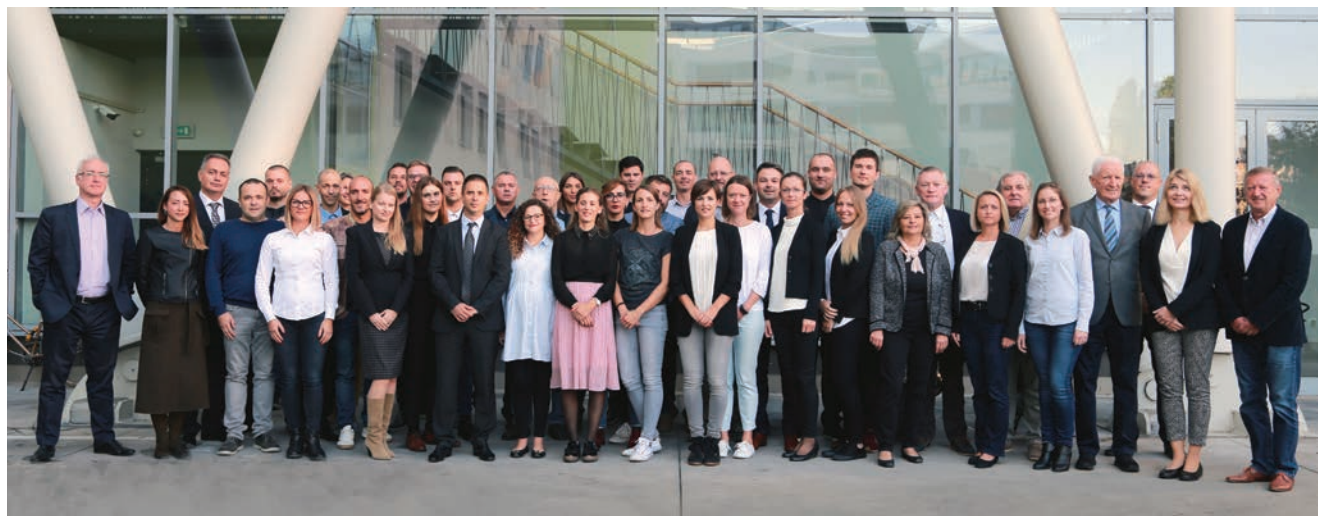
Zajednička fotografija svih zaposlenika GI Grupe ispred sjedišta tvrtke