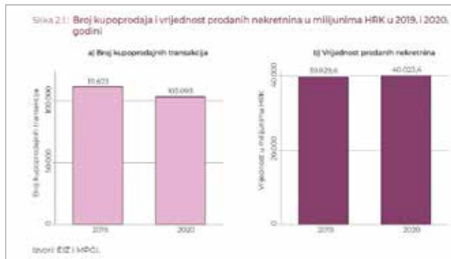
Broj kupoprodaja i vrijednost prodanih nekretnina u 2019. i 2020.