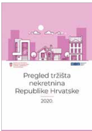
Naslovnica publikacije Pregled tržišta nekretnina Republike Hrvatske 2020.