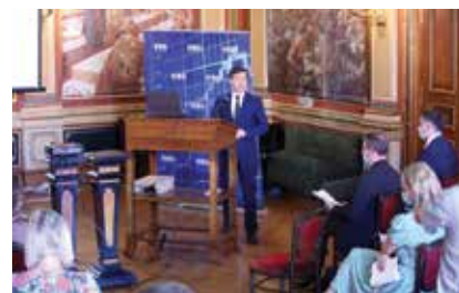
Predstavljanje publikacije u Hrvatskom institutu za povijest

radi o rezidencijalnim tipovima nekretnina). Za svaki pobrojani tip nekretnine i za svaki pokazatelj prikazani su podaci na nacionalnoj razini, na razini županija i jedinica lokalne samouprave te na razini katastarskih općina Grada Zagreba.