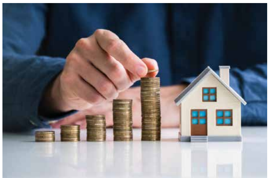
Osim uobičajenih ciklusa na tržište nekretnina utječu posljedice potresa te epidemiološka situacija