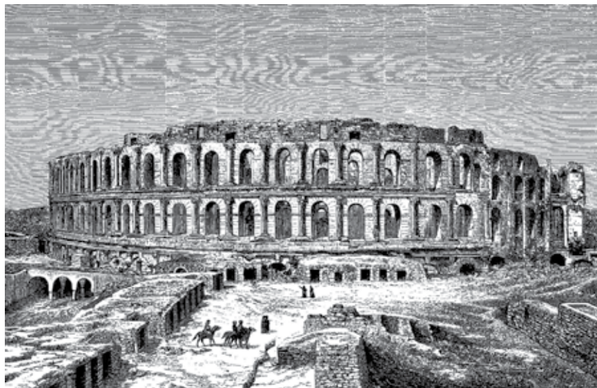
Prikaz rimskog amfiteatra u današnjem El Jemu

mramora i drugih materijala potrebnih za izgradnju tamošnjih javnih građevina (crkva, katedrala, nekoliko palača). Pritom su veliki blokovi bili temeljito razbijani kako bi se došlo do bronce i olova koji su ih držali na okupu, a manje kamenje bilo je korišteno za popločavanje tamošnjih ulica. Uništavanje amfiteatra bilo je zaustavljeno tek u razdoblju Burbona jer ga je kralj proglasio nacionalnim spomenikom.