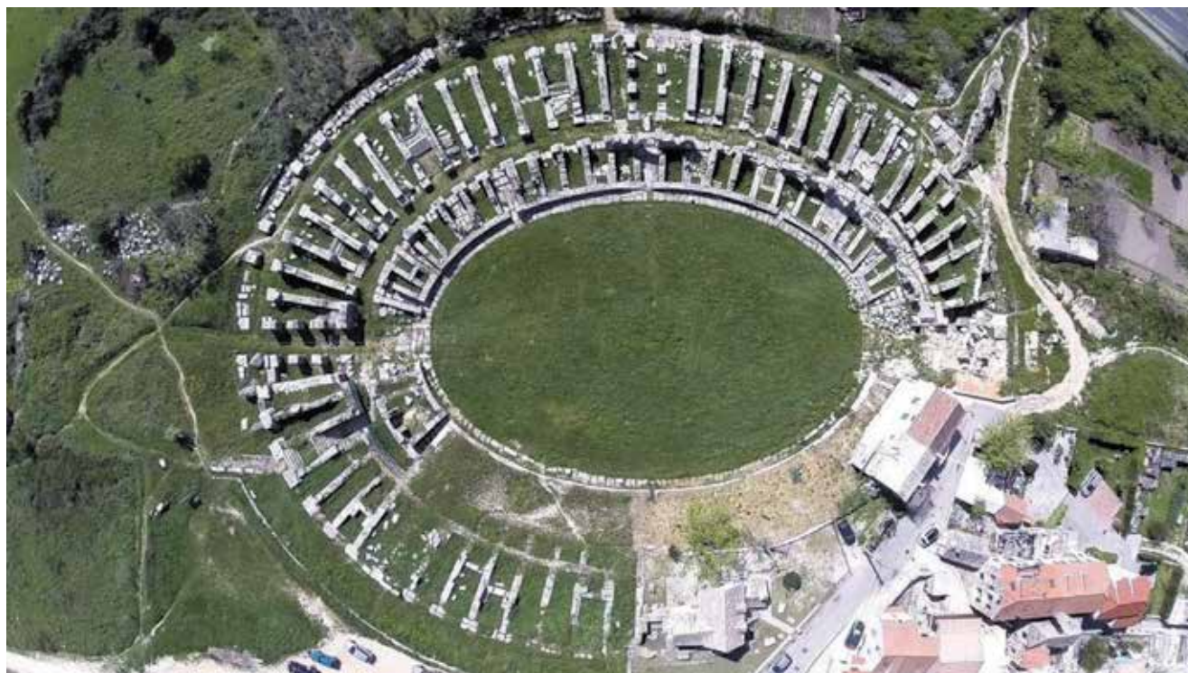
Zračni snimak rimskog amfiteatra u Saloni

scenografski dotjerane, dočaravajući pritom razne mitološke priče ili pak scene iz grčko-rimske povijesti. Međutim, usvajanjem odluka Milanskog edikta iz 313., koji je omogućio prava i slobodu vjere na prostoru Rimskoga Carstva, počeo je proces stagnacije i degradacije rimskih amfiteatara. U kontekstu novonastalih prilika promijenio se stav naspram krvo- ločnih zabava rimskoga svijeta. Još su u vremenu antike postojali protivnici gladijatorskih borbi, koji su izrazili svoj stav i negodovanje spram nehumanih i krvo- ločnih zabava rimskoga svijeta. Uspostavljanjem vjerske slobode te ediktom cara Honorija iz 404. gladijatorske borbe naposljetku su iščeznule. Zabranom gladijatorskih borbi amfiteatri su izgubili prvotnu ulogu i značaj, zbog čega je počeo proces njihove degradacije i transformacije, što se ujedno odrazilo na rimske