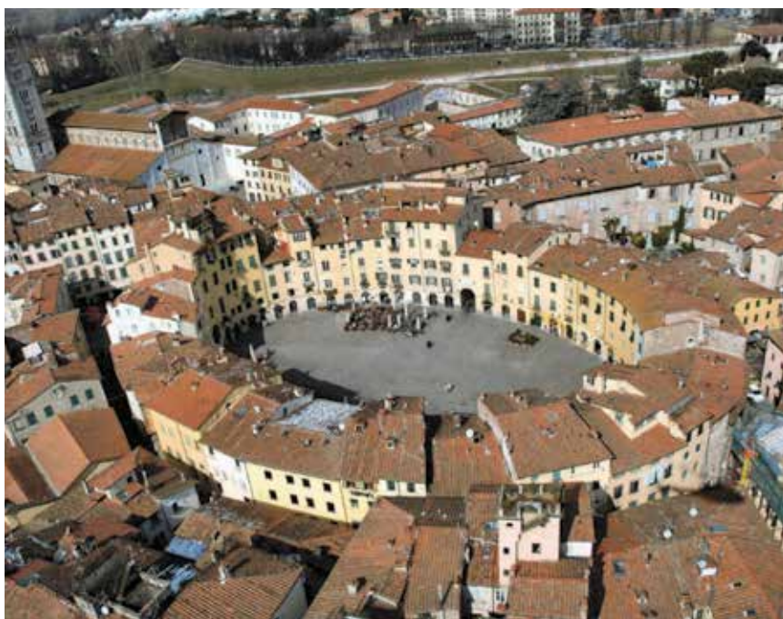
Središnji gradski trg podignut nad ostacima amfiteatra u Lucci

Nakon pada Rimskoga Carstva amfiteatar rimske kolonije Capue doživio je niz oštećenja, najviše tijekom pohoda Vandala ili Saracena 841. Lombardski knezovi iz Capue koristili su amfiteatar kao obrambenu tvrđavu. Rimski se amfiteatar koristio i kao besplatan kamenolom