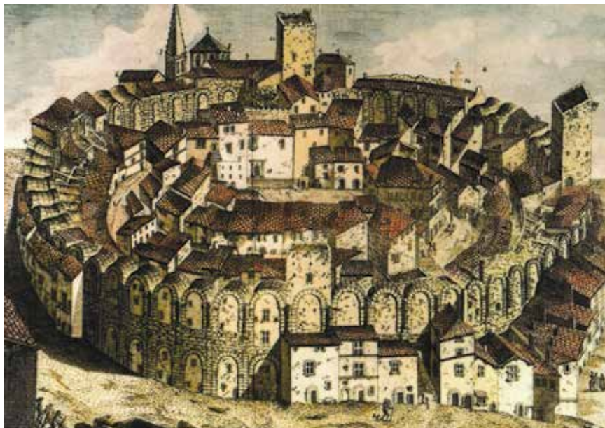
Izgradnja svojevrsne gradske četvrti unutar amfiteatra u Arlesu

taj je način rimski amfiteatar adaptiran i razmontiran radi izgradnje obrambenih zidina pred prijetećom najezdom turskih osvajača.