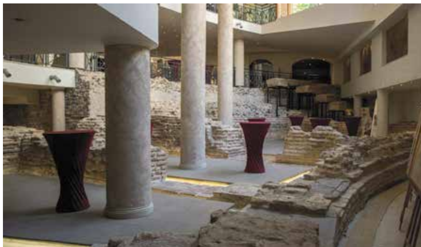
Položaj rimskog amfiteatra unutar današnjeg hotela u Sofiji

stoljeća spominje mnoge dijelove rimskog amfiteatra, odakle su Zadrani, tj. Mlečani, uzimali građevni materijal za gradnju novih građevina odnosno obnovu postojećih javnih građevina. Izgradnja novih bedema i utvrda uslijed ratnih opasnosti i kriznih situacija nije poštedjela pojedine dijelove grada ili pak čitavih predgrađa, što je bio slučaj i u doba turskih ratnih najezdi u XVI. i XVII. stoljeću na prostoru Zadra i gravitirajuće okolice. Zbog dogradnje utvrde Forte, odnosno Mezzalune, mletački providur Antonio Bernardo (1656. – 1660.) naredio je rušenje ostataka rimskog amfiteatra. Tom prigodom dao je uklesati natpis u kojemu sa žaljenjem spominje porušeno zdanje, nekoć poprište gladijatorskih borbi. Na