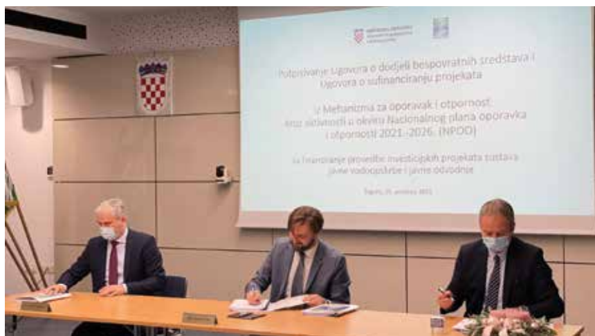
Detalj snimljen tijekom potpisivanja ugovora