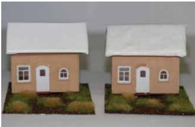
Istraživanja na modelima (desni prekriven novim polimerom)