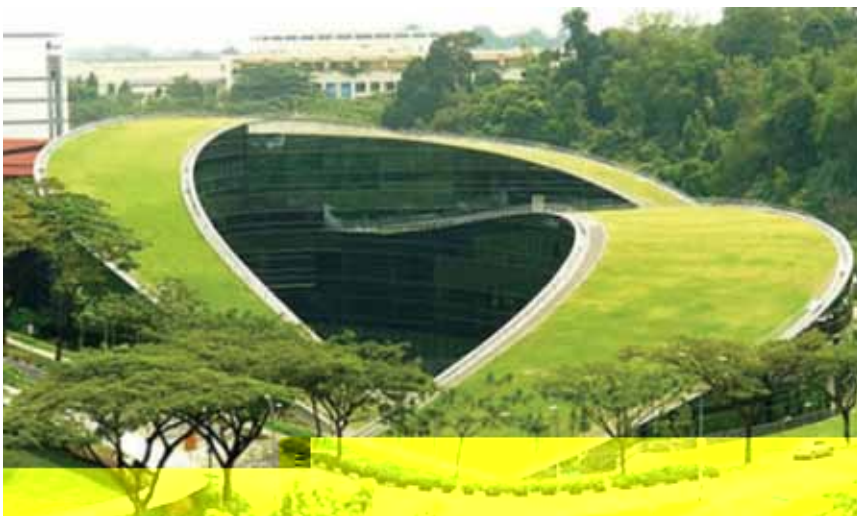
Zelena površina na zgradi

Zeleni su krovovi jedini održivi živi izolacijski sustavi jer štite zgrade od sunčeva zračenja te ujedno smanjuju unutrašnje ljetne temperature i zimi održavaju toplinu