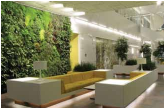
Zeleni zidovi kao dio interijera