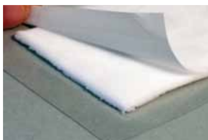
Slojevi prostirke od posebnog polimera (PNIPAM)