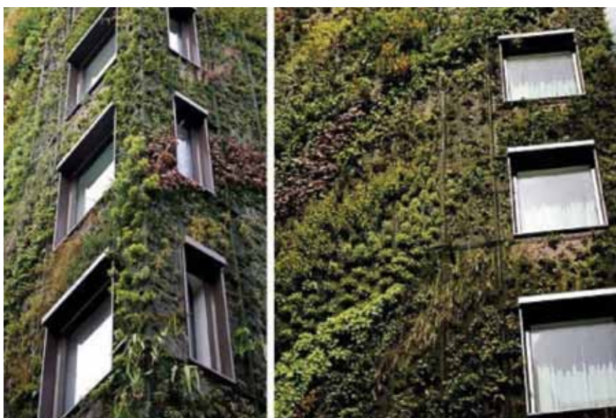
Potkonstrukcija na koju je postavljena tkanina za uzgoj biljaka

Iako vertikalno vrtlarstvo, baš kao i ono tradicionalno, može biti pravi izazov, uz odgovarajuće instalacije i održavanje vertikalni će vrtovi dobro napredovati i obogatiti prostore u kojima su postavljeni.