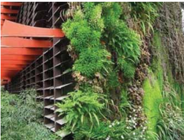
Primjer ozelenjavanja pročelja

Biljke se mogu uzgajati i između slojeva tkanine i one su tada pričvršćene na slojevima proširenog PVC-a, barem tako tvrdi Patrick Blanc, francuski botaničar i autor zaslužan za popularizaciju ideje zelenih zidova i vertikalnih vrtova. Kada se vrtovi postave, tada se hidroponi (zaštićeni prostori za uzgoj biljaka