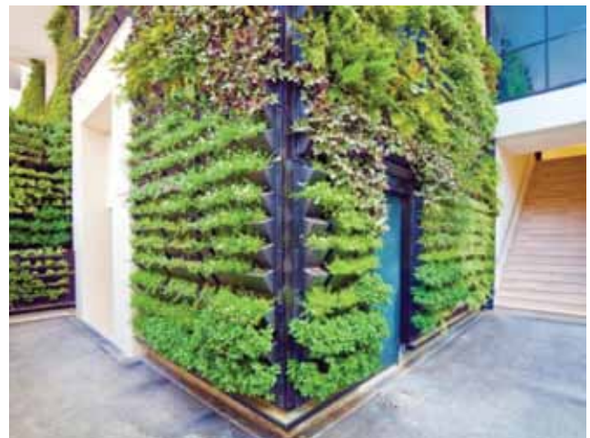
Dio zelenog pročelja na obiteljskoj kući