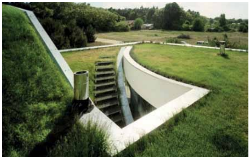
Ulaz u kuću preko zelenog krova

U estetskom su pogledu zeleni krovovi promjenljivi i posebni baš kao i bilo koji drugi oblik. Odluke o oblikovanju i vrsti biljaka u zelenom krovu često se potpuno prepuštaju pejzažnim arhitektima pa zgrade često mijenjaju svoj izgled u odnosu na prvotni. Zeleni krovovi nude i dodatni zajednički prostor te potiču društvenu aktivnost i međusobne odnose na radnom mjestu, društvenim okupljanjima, stambenim zgradama i sl.