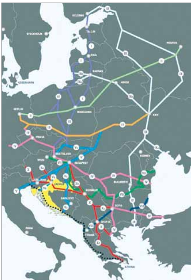
Prikaz svih EU koridora s mogućim dodacima (jadransko jonski pravac)

Inače V. europski koridor je složena cestovna, željeznička, riječna i zračna veza između sjeverne, srednje i južne Europe, a okosnica mu je veza između Venecije, Trsta i Kopra, Ljubljane, Maribora, Budimpešte, Užgoroda, Lavova i Kijeva. Na tu se osnovnu vezu nadovezuje ogranak A koji spaja Bratislavu sa Žilinom, Košicama i Užgorodom, ogranak B kao spoj Rijeke, Zagreba i Budimpešte te već spominjani ogranak C između Budimpešte i Ploča.