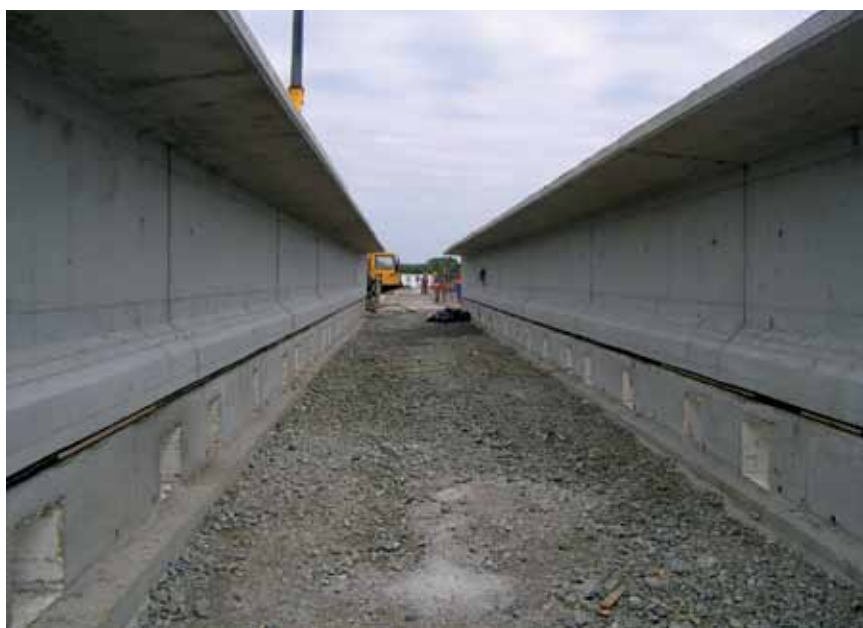
Montažni armiranobetonski nosači za dio mosta preko plavišta

koji sa zadovoljstvom i iskustvom obavljaju svoj posao. To se odnosi i na članove nadzornog tima koji većinom sačinje inženjeri iz Instituta IGH – PC Osijek .