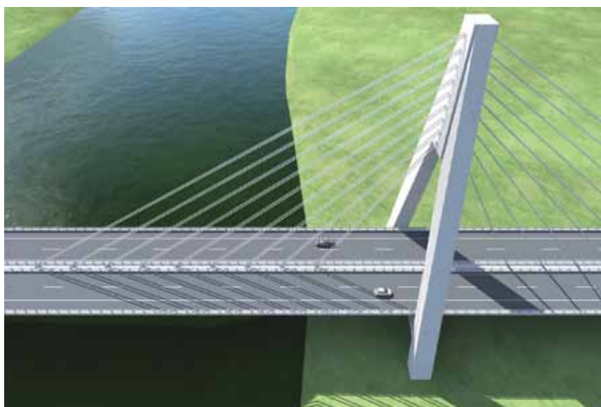
Prikaz budućega mosta u prometnoj uporabi

Poprečni presjek dilatacijskih cjelina tvori po 6 montažnih širokopojasnih predgotovljenih armiranobetonskih prednapetih nosača T-presjeka (visokih 182 cm) u međusobnom razmaku od 2,15 m. Širina je gornje pojasnice nosača 213 cm, donje 64, a hrbat je širok 24 cm. Iznad njih se betonira ploča debljine 25 cm pa tako cijeli sustav postaje kontinuirani roštilj koji tvore montažni nosači, poprečni iznad oslonaca i kolnič-