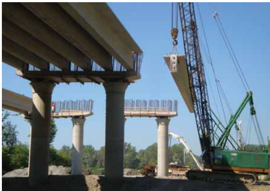
Montaža AB prednapetih nosača, lipanj 2012.

Nadomak gradilišta uređeno je mjesto za proizvodnju montažnih prednapetih nosača Hidroelektre , odmah ispod dravskoga nasipa. Potom smo prošli dio gradilišta koji pripada Konstruktoru i gdje se zaista ništa ne radi. No zato dio do Drave koji pripada Hidroelektri Niskogradnji ima gotovo sva izgrađena stupišta i predstoji montaža nosača. I ovdje su se za našeg posjeta ugrađivali piloti za pilon na baranjskoj strani.