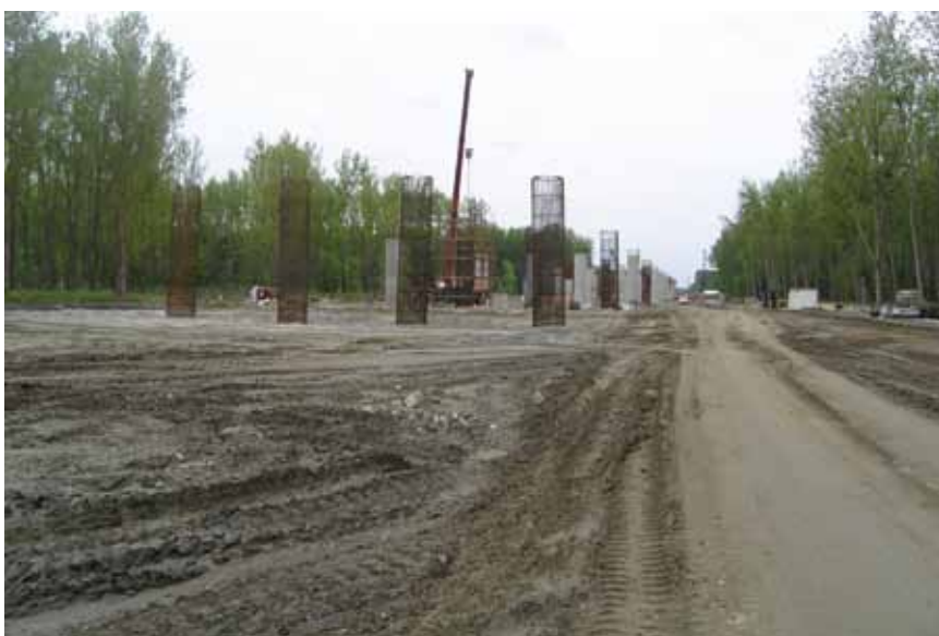
Početak gradilišta Hidroelektrane Niskogradnje

Gradnju mosta preko rijeke Drave kod Osijeka na važnome međunarodnome prometnom koridoru prate svi problemi i kontroverze našega sadašnjega gospodarskog i političkog trenutka. Ugovor je o gradnji zaključen sa sadašnjom poslovnom udrugom 2009. uoči lokalnih izbora, ali nikakvi radovi nisu započeli. Ipak ugovor nije raskinut jer bi HAC morao platiti visoku odštetu, a građevinari su strpljivo čekali bolja vremena i početak radova. To se i dogodilo uoči novih izbora 2011. kada je HAC uspio od