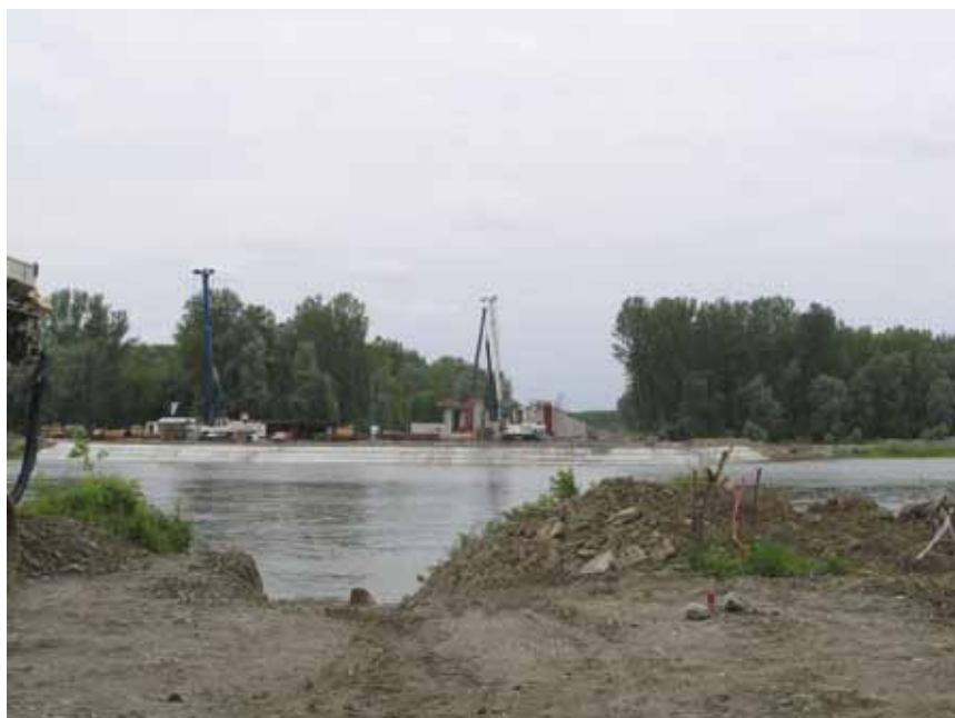
Pogled s baranjske strane na gradilište mosta

Partneri su međusobno podijelili ugovorene radove tako da je prva tri stupišta s upornjakom i montažom nosača na baranjskoj strani, dakle dio koji je uz glavni dravski nasip, dobio Osijek Koteks , a od stupišta S4 do S18 Konstruktor-inženjering da bi sve potom