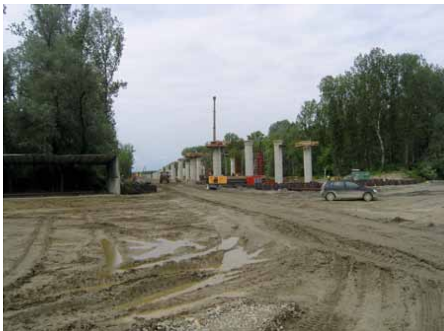
Dio izvedenih stupova novog mosta

Ing. Siniša Jakšić koji se specijalizirao za nadzor građenja mostova očekuje da će nakon završetka mosta preko Drave možda i u zasluženu mirovinu. Usto dodaje da je vrlo ugodno surađivati s ljudima