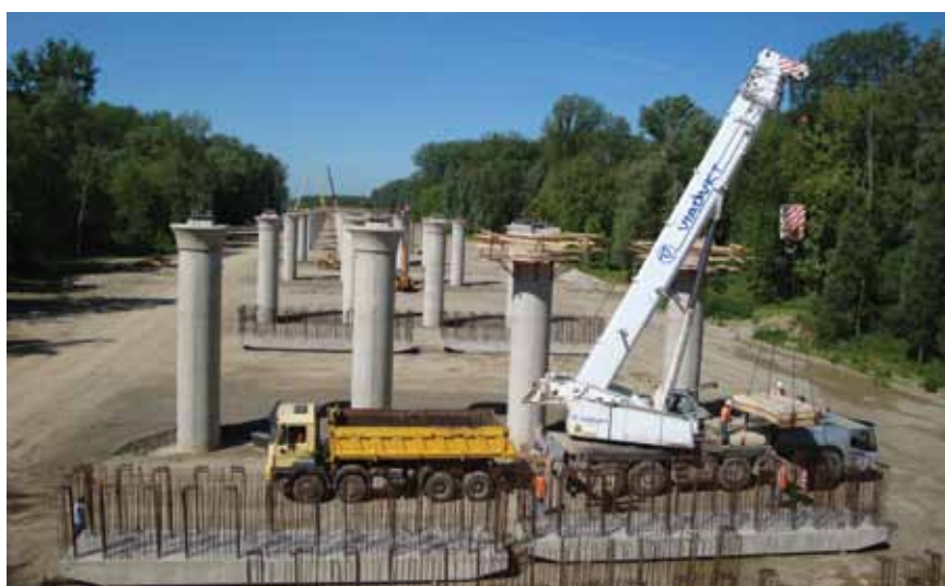
Izgrađena stupašta slavonske strane, lipanj 2012.