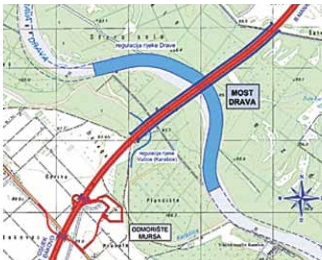
Mjesto prijelaza mosta preko rijeke Drave

Od prošle se godine gradi i najsloženija i najskuplja građevina na cijeloj trasi – most preko rijeke Drave pokraj Osijeka koji je ključan za daljnji nastavak autoceste prema Mađarskoj.