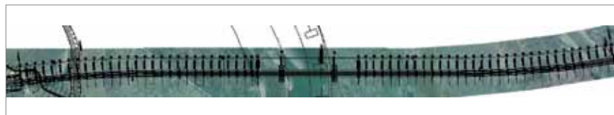
Tlocrtni prikaz mosta preko Drave

Na smještaj, dužinu i izgled mosta preko rijeke Drave na autocesti prema Belom Manastiru utjecalo je nekoliko ključnih čimbenika, ponajprije uvjeti plovidbe rijekom Dravom koja je plovna u dužini od 90 km – od ušća do mjesta Čađavice u Virovitičko-podravskoj županiji. Plovni je profil uzvodno od Osijeka na neki način prilično neo-