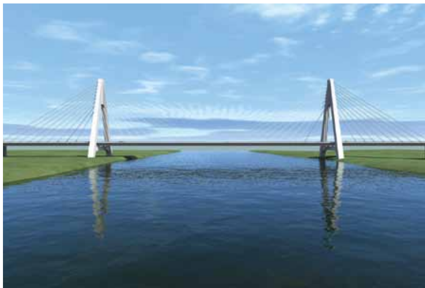
Prikaz budućega izgleda mosta preko Drave

Povoljan omjer glavnog i bočnih raspona omogućio je svladavanje rijeke s dva A pilona okomita na vertikalnu os kao i napinjanjem zatega kako bi se smanjio moment savijanja uzrokovani vlastitom težinom konstrukcije te dodatnim stalnim i prometnim opterećenjem. Piloni su visoki 75 m s krakovima pravokutnoga poprečnog presjeka ( 4 \times 5 m) koji se prema vrhu blago mijenja i širi ( 3,5 \times 6 m). Poprečno je povezan trokutom na vrhu gdje se izravno vješa spregnuta čelična greda preko dva reda kosih zatega koje prenose opterećenje glavnog i bočnih raspona. S prednje su i sa stražnje strane svakog pilona po dva reda od 10 zatega, a stupovi su pilona temeljeni na dvije grupe od po 25 bušenih pilota (promjera 150 cm).