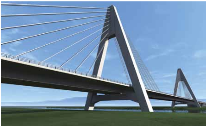
Prikaz pilona i dijela donjeg ustroja mosta preko Drave

Kosi su kabeli formirani od pojedinačnih užadi (presjeka 150 \text{ mm}^2 ) s odgovarajućim kosim i podesivim kotvama, a užad je u slobodnom dijelu zaštićena HDPE (high-density polyethylene – polietilen visoke gustoće) cijevima s rebrima za sprečavanje vibracija od vjetera. U donjem je dijelu, do visine od 2 m, dodatno zaštićena čeličnim cijevima (tzv. anti-vandalska zaštita).