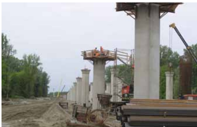
Dio gradilišta koji pripada Viaduktu