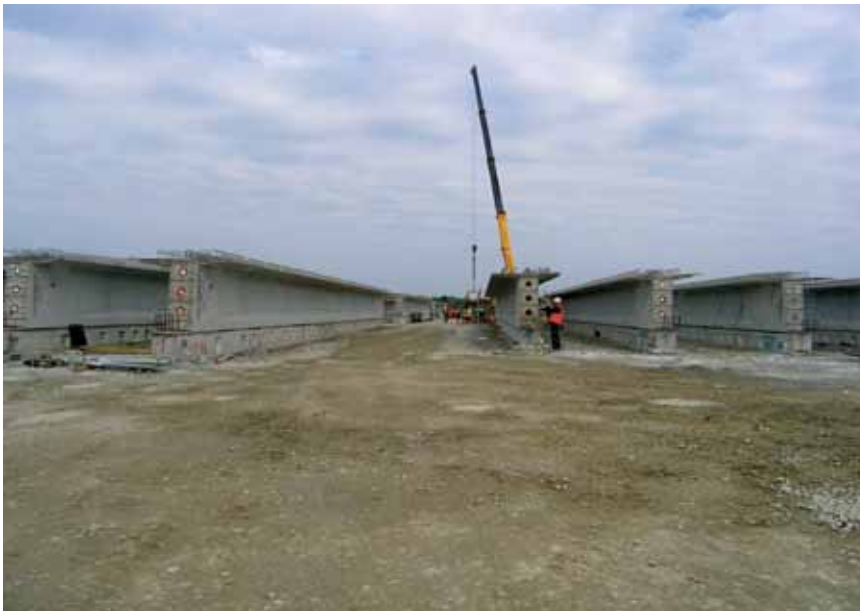
Izrada armiranobetonskih nosača na gradilištu Skladgradnje-grup

moogućeg prodora podzemnih voda bilo osigurano čeličnim talpama. Razgledali smo i fotografirali gradilište na osječkoj strani rijeke, a ujedno promatrali i radove na drugoj obali, pa smo uočili da je obaloutvrda većim dijelom završena. Usput smo doznali da će se čelična konstrukcija mosta preko rijeke Drave izvoditi naguravanjem i da će se za to i na baranjskoj i na osječkoj strani, ali i u koritu rijeke, izgraditi četiri privremena čelična oslonca.