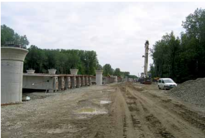
Dio gradilišta Skladgradnje-grup

Čelična će se konstrukcija, koja još nije ugovorena, izvoditi naguravanjem pa će se na baranjskoj i osječkoj strani te u koritu rijeke izgraditi privremeni čelični oslonci