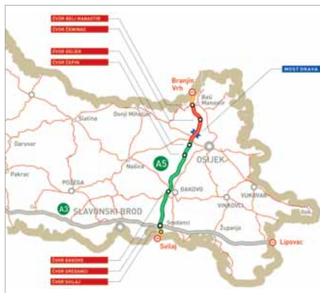
Prikaz autoceste A5 sa svim glavnim prometnim građevinama