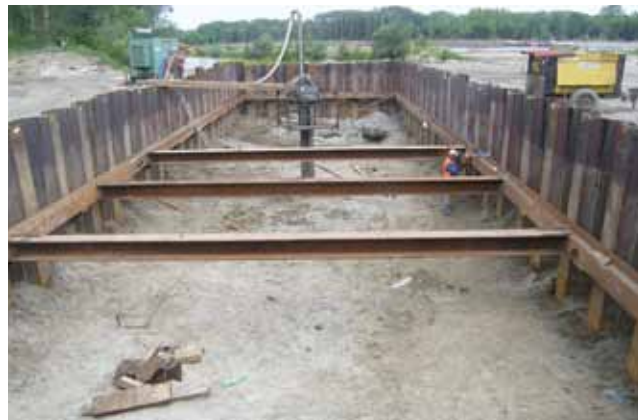
Mjesto za pobijanje pilota za pilon na osječkoj strani mosta