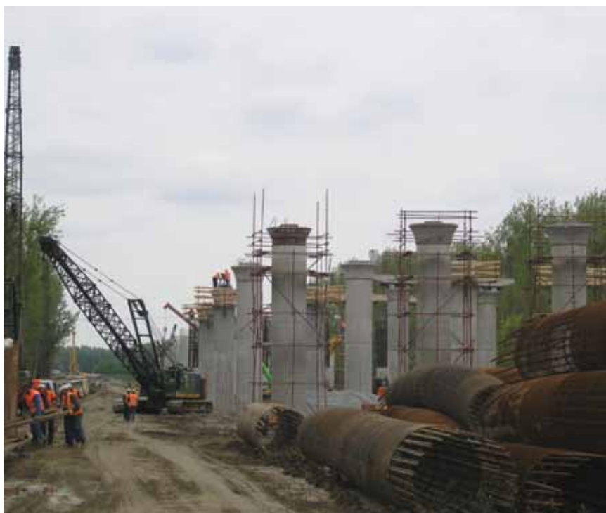
Radovi na lijevoj obali Drave

Činjenica da dva velika mosta odnosno vijadukta imaju potpuno istu dužinu i da se nalaze na rubovima većih gradova te da su istodobno najduži u državi zaista je zanimljivost koja zaslužuje posebnu pozornost. Drežnik je otvoren 2001. u trenucima kada su svi bili nestrpljivi da se autocestom povežemo s