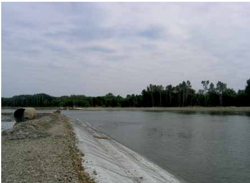
Uređenje lijeve i desne obale rijeke Drave

radnika Osijek Koteksa jer su njihovi poslovi i prostorno rašireni.