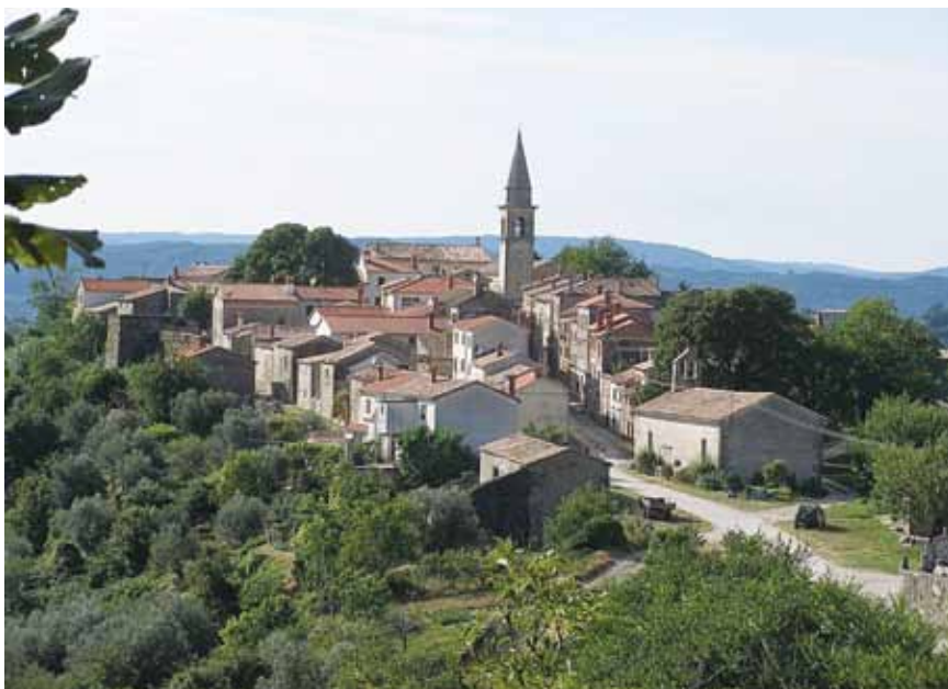
Pogled na Draguč i glavnu ulicu

korte od koje je gotovo u cijelosti sačuvana i danas vrlo dojmjljiva sjeverna četvrtina. Daljnjom feudalizacijom naselje mijenja oblik i za vladavine grofova Goričkih u istočnom dijelu korte (ranosrednjovjekovni potkovasti ili kružni blok od skupova stambenih i gospodarskih građevina oko središnjega slobodnog prostora) podiže se snažna utvrda pravokutnoga tlocrta, a u južnom dijelu manje podgrađe s nizom kuća i ulica okomitih na zidove negdašnjeg kaštela.