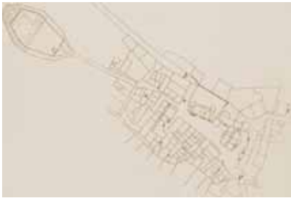
Tlocrt Vrha (prema K. Horvat-Levaj)

U dokumentima se prvi put spominje 1195., a kao župa od 1231. godine. U to je vrijeme bio u sastavu vlastelinstva Sovinjak, s kojim dijeli povijesnu sudbinu do današnjih dana. U srednjem je vijeku zajedno sa Sovinjakom pripadao akvilejskim patrijarsima. Vrh je naime bio pomoćna tvrđava većem sovinjanskom kaštelu i nakon 1350. pripao je Pazinskoj grofoviji, a od 1370. dijelom austrijskog teritorija. Vrh je do 1500. s okolicom bio u sastavu Austrije odnosno Pazinske grofovije, ali ga je nedugo potom, 1508. nakratko zauzela Mletačka Republika da bi od 1511. konačno potpao pod njihovu vlast. Od mira u Wormsu 1523. i presude u Tridentu (Trentu) 1535., Vrh je bio sastavni dio Mletačke Republike u Istri sve do njezina nestanka krajem 1797. godine. Za mletačke je vladavine to područje bilo u