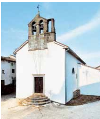
Crkva Presvetog Trojstva u Račicama

Kaštel je danas barokna rezidencija iz 18. st., a nastao je nadograđivanjem i preuređenjem starije renesansne, možda i srednjovjekovne utvrde. Riječ je o stambeno-obrambenom kompleksu koji se sastoji od trokutastoga utvrđenog dvorišta, manje gospodarske građevine naslonjene na sjeverni obrambeni zid te pročeljnoga dvokatnoga ulaznog krila na istočnoj strani. Vanjsko je pročelje ukrašeno lijepim polukružnim portalom, a iznad njega je balkon s kovanom željeznom ogradom. Premda je u 18. st. dvorac temeljito obnovljen, o negdašnjoj obrambenoj namjeni osim bedema svjedoči i skošeno podnožje stambenoga krila te obrambeni jarak