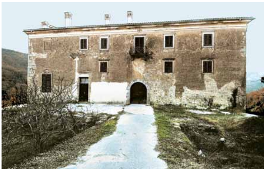
Dvorac u Račicama

U brdovitom krajoliku središnje Istre, sjeverozapadno od Račica, nalazi se negdašnji kaštel Vrh (tal. Vetta ), danas manje selo 11 km jugozapadno od Buzeta. Leži na dominantnom položaju u brdima između rijeka Mirne i Butonige i iznad akumulacije Butonige, na 396 m n.v. i pokraj županijske ceste koja ga spaja s Buzetom. Izgrađen je na ostacima prapovijesne gradine koju je navodno naseljavalo keltsko pleme Subokrina. Poslije su ga držali Rimljani, a ime Vrh dali su novodoseljeni Hrvati, što je za romansko stanovništvo bilo vrlo teško, pa su ga Mlečani primjerice zvali Verch.