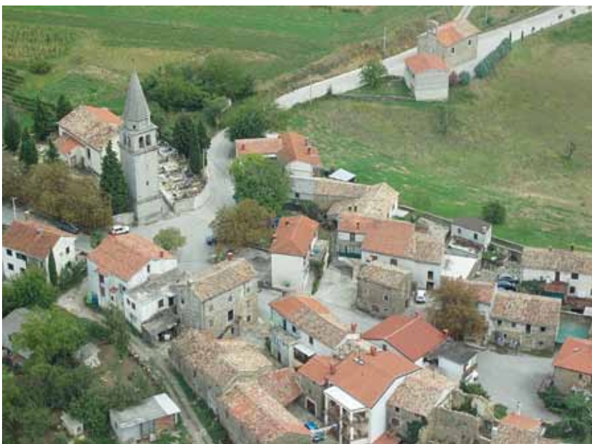
Pogled iz zraka na Vrh

Povijesna jezgra Vrha cijelom površinom zauzima glavicu dugačke i uske zaravni izdužene i blago položene prema jugu, koja je padinama sa zapadne i istočne strane odvojena od susjednih obronaka. Urbanističku okosnicu čini glavna ulica omeđena nizovima kuća koje se protežu od srušenih južnih (Mala vrata) do sjevernih vrata (Vela vrata), gdje se širi u manji plato na rubu naselja sa župnom crkvom Uznesenja Blažene Djevice Marije koja dominira cijelim naseljem i krajem. Od Malih vrata sačuvan je zaglavni kamen s uklesanom 1794. godinom, naknadno uzidan u pročelje jedne kuće uz negdašnja vrata. Prema Katarini Horvat-Levaj i po analogiji sa sličnim ranosrednjovjekovnim naseljima može se pretpostaviti da se na mjestu sadašnje crkve ili pokraj nje nalazio kaštel ili branič-kula feudalnog gospodara. Naime, povezanost je stambene gradnje u linijske izdužene nizove usmjerene prema fortifikacijskoj jezgri (kaštelu) posebnost srednjovjekovnih utvrđenih naselja u pograničnim istar-