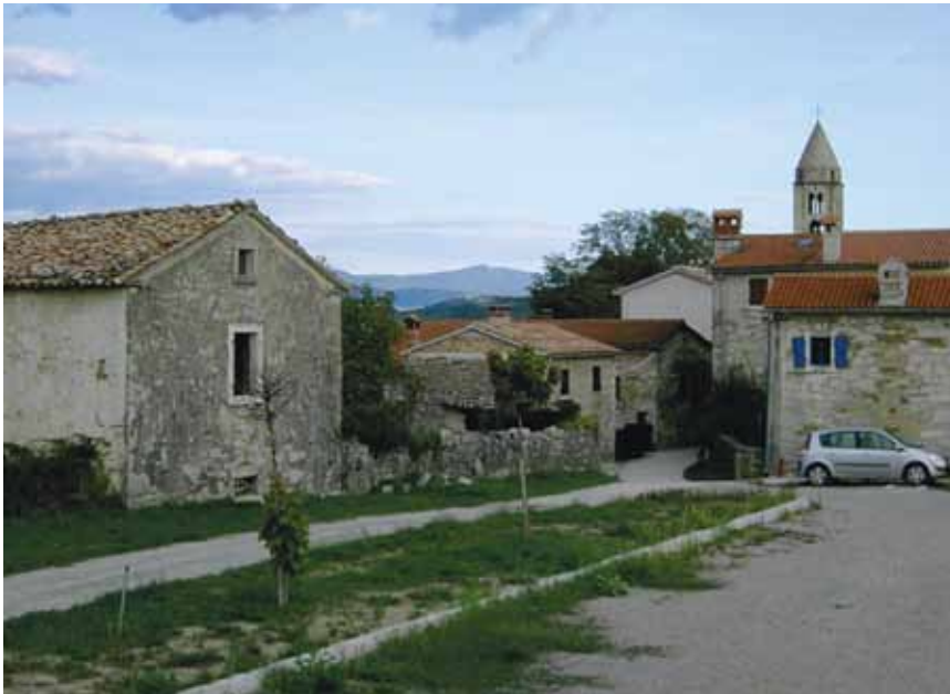
Sovinjak snimljen sa stražnje strane

Sv. Jurja. Crkva je manja trobrodna građevina s pravokutnim svetištem i sakristijom na spoju s brodom, a izgrađena 1927. na mjestu znatno starije iz 1556. Ima zanimljivo klasicističko pročelje čijim središtem prevladava renesansni zvonik od 15 m, izgrađen 1557. (glagoljski je natpis o dovršetku uništen 1921.). Zvonik je posebno značajan jer je jedan od najstarijih u Istri građen prema akvilejskom modelu. Bio je znatno drukčiji od srednjovjekovnih obrambenih zvonika koji su završavali obrambenim kruništim. Kvadratnog je tlocrta s biforama pri vrhu i natkriven osmerokutnom lanternom i stožastom kapom. Od ostalih sačuvanih povijesnih građevina Sovinjaka, uglavnom nastalih od 16. st., ističe se mala kasnogotička kapela Sv. Roka s početkom 16. st. Manja je to jednobrodna građevina bez apside, nadsvođena šiljasto-bačvastim svodom i 1571. ukrašena zidnim slikama koje je izradio Dominik iz Udina ( Domenicus Utinensis ). Ispred je pročelja trijem (lopica), a iznad visoka preslica s dva manja i dva veća otvora za zvona. Trijem je podignut 1682. u baroknom stilu s elegantnim kamenim stupovima. Od svjetovnoga graditeljstva vrsnoćom se ističu žitnica iz 1647., s kamenim reljefom raspela na pročelju, te neko-