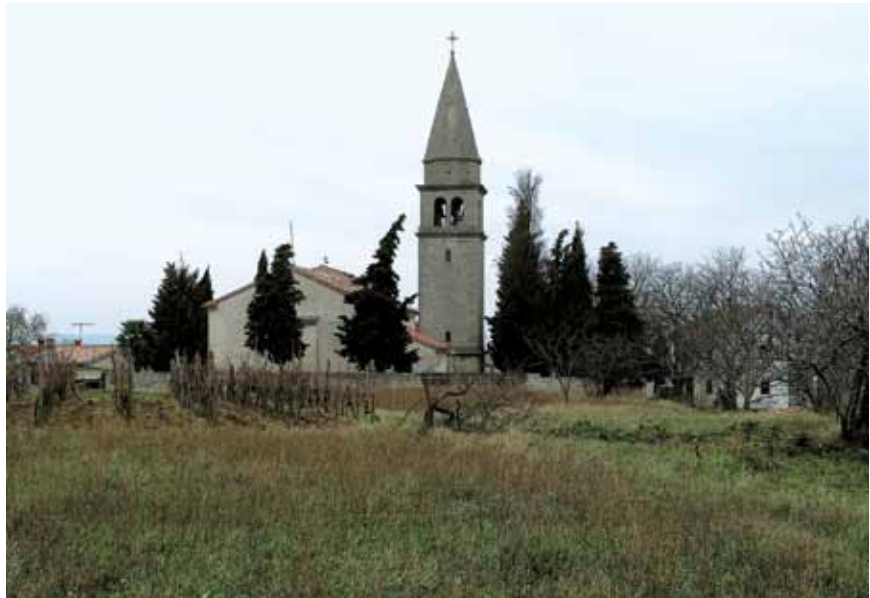
Župna crkva Uznesenja Blažene Djevice Marije u Vrhu

U dokumentima se prvi put spominje 1195., a kao župa od 1231. godine. U to je vrijeme bio u sastavu vlastelinstva Sovinjak, s kojim dijeli povijesnu sudbinu do današnjih dana. U srednjem je vijeku zajedno sa Sovinjakom pripadao akvilejskim patrijarsima. Vrh je naime bio pomoćna tvrđava većem sovinjanskom kaštelu i nakon 1350. pripao je Pazinskoj grofoviji, a od 1370. dijelom austrijskog teritorija. Vrh je do 1500. s okolicom bio u sastavu Austrije odnosno Pazinske grofovije, ali ga je nedugo potom, 1508. nakratko zauzela Mletačka Republika da bi od 1511. konačno potpao pod njihovu vlast. Od mira u Wormsu 1523. i presude u Tridentu (Trentu) 1535., Vrh je bio sastavni dio Mletačke Republike u Istri sve do njezina nestanka krajem 1797. godine. Za mletačke je vladavine to područje bilo u