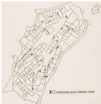
Tlocrt Sovinjaka (prema K. Horvat-Levaj)

Najsjeverniji i najzapadniji među kaštelima porječja Butonige, uostalom i najbliži rijeci Mirni na koju se pruža dojmljiv pogled, jest kaštel Sovinjak (tal. Sovignacco ), sada manje seosko naselje 8 km jugozapadno od Buzeta. Središte je Sovinjštine, brežuljkastoga kraja iznad srednjeg toka Mirne. Osim Sovinjaka tu mikroregiju čine još zaseoci Beneži, Brnozi, Jermanija i Majeri te naselja Pračana, Sirotići, Sovinjsko Polje, Sovinjsko Brdo i sl. Lokalno se stanovništvo pretežno bavi poljodjelstvom, vinogradarstvom i pčelarstvom. Negdašnji se kaštel Sovinjak nalazi na izduženoj zaravni iznad rijeke Mirne, na 283 m n.v. Manji je to utvrđeni gradić čiji obrambeni zidovi još uvijek dijelom okružuju vrh brežuljka u obliku izduženoga nepravilnog četverokuta. Razvio se kao manje podgrađe uz kaštel, za kojega se vjeruje da je bio na prostoru današnjeg groblja, uostalom i ima toponim Kaštel.