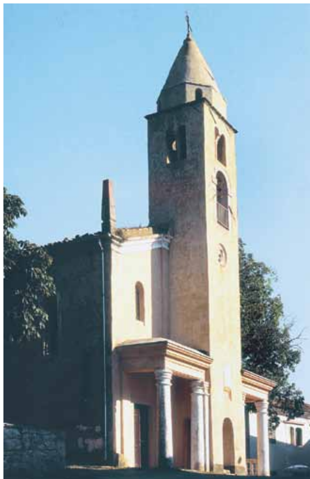
Crkva i zvonik Sv. Jurja u Sovinjaku