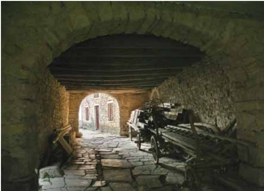
Barokni portik ili sotoportik u Draguču

Iz srednjovjekovnog razdoblja, uz kaštel i utvrđeno podgrađe potječe i grobljanska crkva Sv. Elizeja iz 12. st., smještena izvan naselja uz prilaznu cestu. To je manja romanička jednobrodna građevina pravokutnoga tlocrta s upisanom polukružnom apsidom i ravnim stropom te preslicom na pročelju. Osobitost joj je koloristički efekt vanjskih zidnih ploha, dobiven naizmjeničnim slaganjem redova kamenja tamnije i svjetlije boje, a u unutrašnjosti romaničke freske iz 13. st. sa znatnim bizantskim utjecajima ( Rođenje Krista, Poklonstvo kraljeva, Bijeg u Egipat, Posljednja večera, Judin poljubac, Raspeće, Polaganje u grob, Navještenje na trijumfalnome luku te likovi svetaca na bočnim zidovima). Freske su otkrivene tek 1947., a restaurirane od 1986. do 1988. Posebnost je crkve i oltarni stup koji je zapravo rimski nadgrobni spomenik.