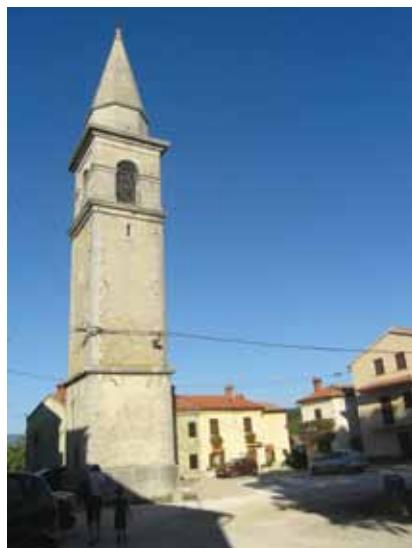
Zvonik župne crkve Sv. Križa

19. st., ali pozornost privlači oltarna slika Sv. Fabijana i Sv. Sebastijana koju je 1846. naslikao Venerio Trevisan (1797.–1871.), slikar iz Vodnjana. Oltarna pala Svete obitelji, Sv. Valentina i Sv. Antuna Opata potječu iz 17. st., a grobnice i orgulje iz 18. st. Uz crkvu je i samostojeći zvonik, izgrađen kao visoki pravokutni toranj čiji je najviši dio na svim stranama otvoren lučnim prozorima te natkriven manjim osmerokutnim tamburom i stožastom piramidalnom kapom.